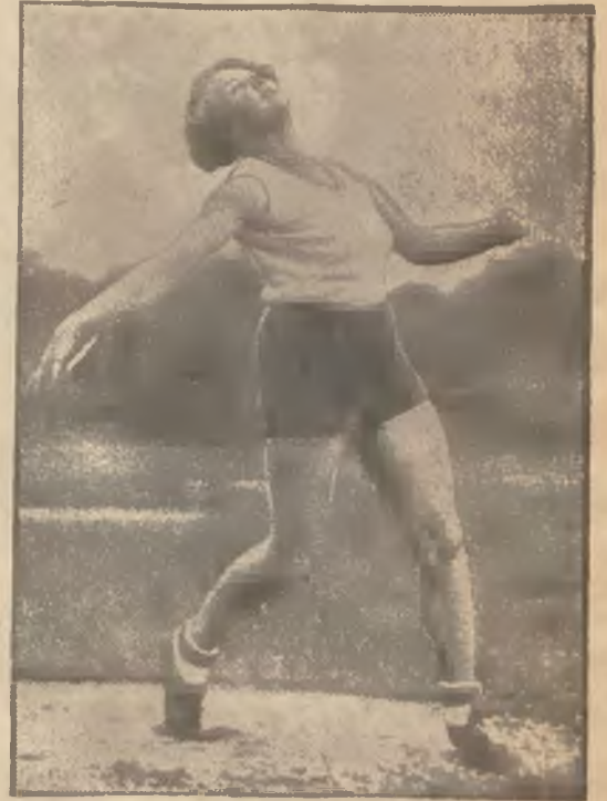
Świetna miotaczka polska Jadwiga Wajsołna.

Wyciąć i przesłać do Admin. „Nowego Dziennika”, Kraków, Orzeszkowej 7 — jako druk za opl. 5 gr.