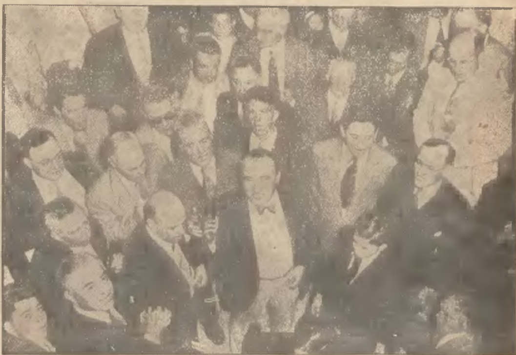
(—) Na zakończenie sesji parlamentu amerykańskiego posłowie odśpiewali wspólnie pieśń połączoną. Czy koncert ten zadowolił z punktu widzenia artystycznego — to już rzecz inna.