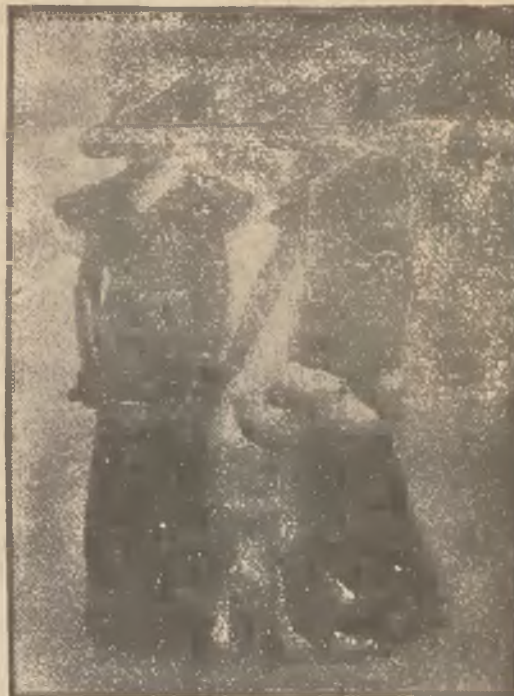
(—) Podczas ostatnich wyścigów w Paryżu odbył się konkurs mody, na którym wielkim sukcesem cieszyły się suknie z czarnego błyszczącego materiału, bardzo obcisłe skrojone.