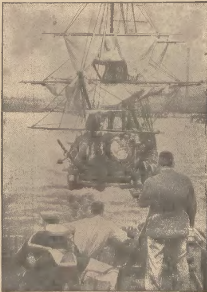
W Anglii dokonano ostatnio zdjęć filmowych modelu, przedstawiającego statek admirała Nelsona.

dzieży, aby ją uzdolnić do objęcia odpowiednich nowych posterunków pracy w Palestynie i w kraju. Powzięto szereg rezolucyj, zmierzających do zrealizowania podniesionych postulatów.