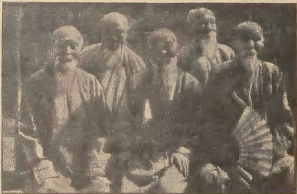
§ Tych oto 5 starszych panów, mieszkańców Pekinu, liczy sobie razem 400 lat. Są oni w zarządzie „Klubu brodaczy” — który zgodnie ze starożytną tradycją — strzeże bacznie pielęgnacji brody.