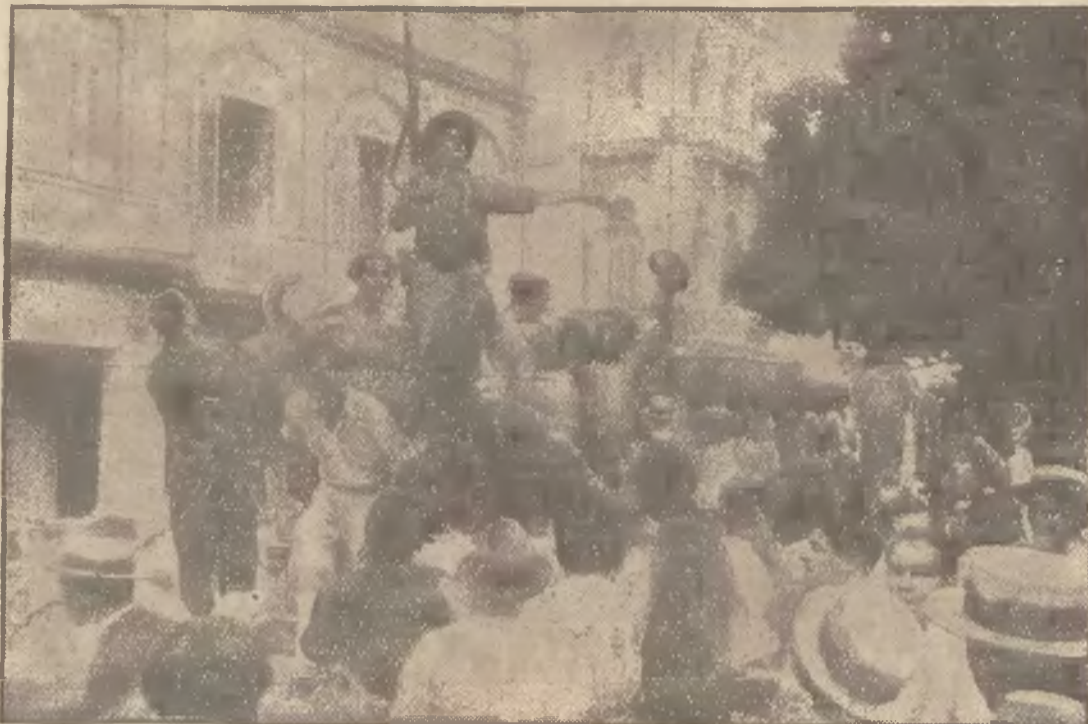
(g) Jak przystało na prawdziwych południowców, rewolucjoniści na Kubie wykazują w swych wystąpieniach dużo patosu i prawdziwie rewolucyjnych... gestów. Oto scena z tej rewolucji.