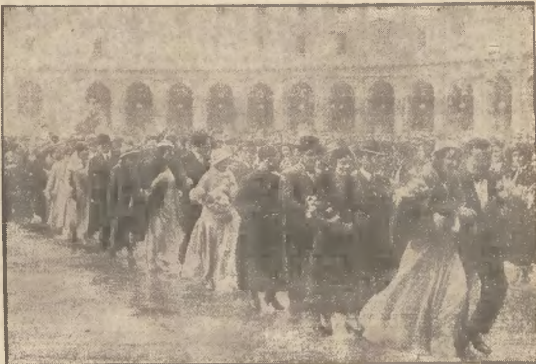
(—) We Włoszech zawierane są obecnie masowo małżeństwa. Rząd Mussoliniego walczy ze spadkiem urodzeń. Dla 60.000 par, które w najbliższych miesiącach pójda do ołtarza, ufundował Mussolini po jednej kolyse i po jednym garniturze białizny dla niemowlęcia. Można się więc śmiało już żenić... Na naszej rycinie — scena pochodu młodych par do ślubu.