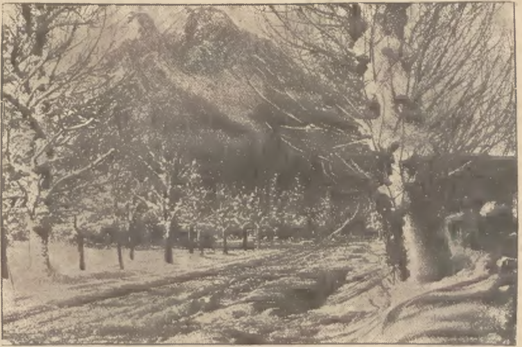
(—) W górach alpejskich spadł już śnieg

Jest to pierwszy aeroplan, który posiada wśród swojego uzbrojenia armatę ciężkiego kalibru; pociski jej eksplodować będą w czasie walk powietrznych, rażąc śmiertelnie samoloty nieprzyjacielskie. Podczas ostatniej wojny światowej samoloty miały tylko karabiny maszynowe; żaden z nich nie posiadał nawet lekkokalibrowej armatki. Dotychczas nie umiano skonstruować statku powietrznego, który mógłby unieść cięższą broń. Teraz dopiero rozwiązano to niezmiernie trudne zadanie; ani ciężar, ani nawet wstrząs, który następuje wskutek strzału ciężkiego działa, nie będzie już stanowił przeszkody w locie. Działo tego samolotu może oddawać sto strzałów na minutę, strzelając pociskami półtorafuntowymi, donośność jego wynosi milę angielską. Będzie to straszliwa broń przeciwko innym samolotom, a zwłaszcza przeciwko balonom sterowym. Doświadczenia ostatniej wojny wykazały, iż aeroplan podziurawiony nawet kulami jak rzeszoto nie spada jednak, ołki najistotniejsze części jego motoru pozostały nieknięte. Armaty nowego aeroplanu angielskiego będzie niesłychanie groźna przede wszystkim dla motorów; pozatem pociski jej razić będą skuteczn