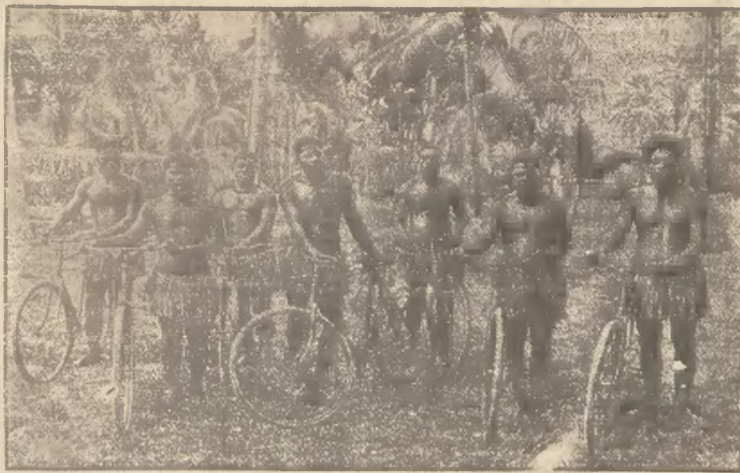
(—) Mieszkańcy wysp na Oceanie południowym używają obecnie w wielkiej ilości — rowerów. Import ten forsuje Japonja, sprzedając rower po 3 dolary. Jest to niesłychany dumping, uprawiany oczywiście, kosztem głodowych płac własnych robotników.