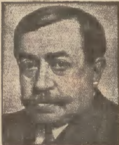
Pawel Painlevé, wielki mąż stanu i uczoney.