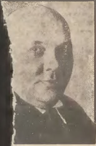
Ludowy F. E. Sillanpää ma otrzymał nagrodę literacką Nobla.