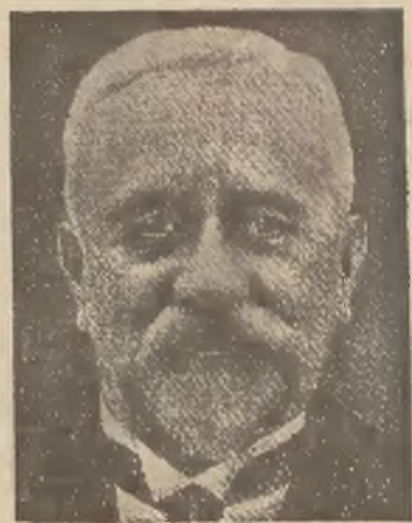
Prof. Albert Calmette, wynalazca szczepionki przeciw gruźlicy. Obaj zmarli w 70 roku życia.