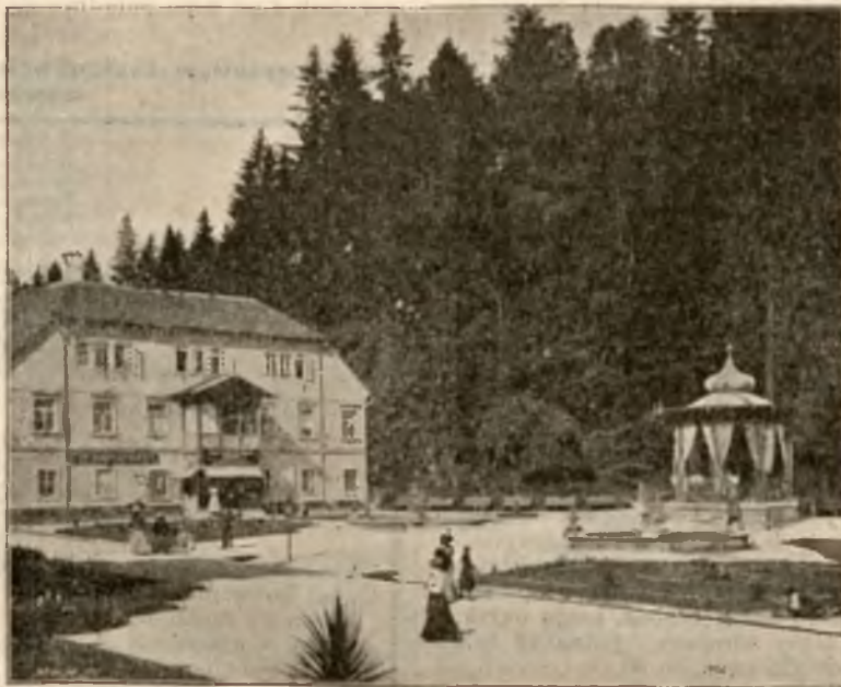
DOM „POD ORŁEM” I PAWILON DLA MUZYKI.

Od 15-go czerwca osobne bezpośrednie wagony z Krakowa i Podwo- łoczysk.