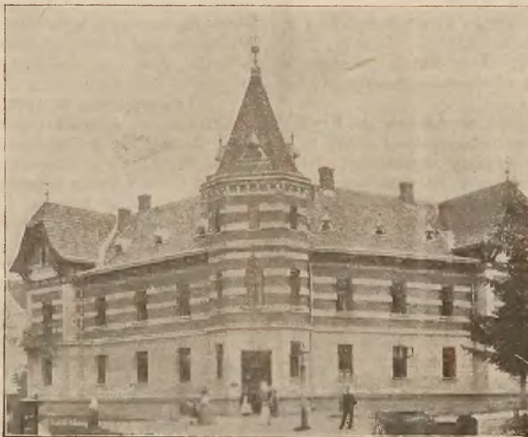
Willa „pod Koroną“.

Osobne bezpośrednie wagony z Krakowa i Podwołoczysk.