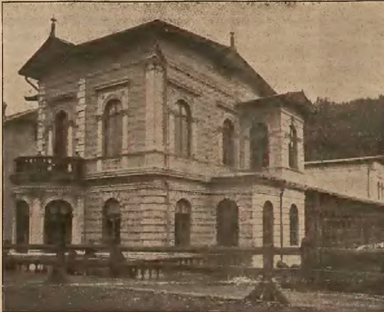
Łazienki borowinowe w Krynicy.

Osobne bezpośrednie wagony z Krakowa i Podwołoczysk.