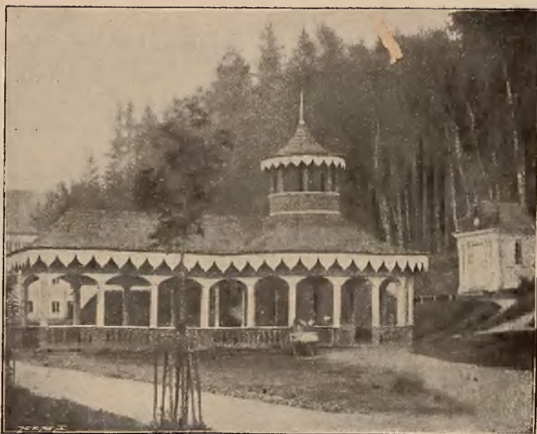
KAPLICZKA ZA ZDROJEM GŁÓWNYM.

Osobne bezpośrednie wa- gony z Krakowa i Pod- woleczysk.