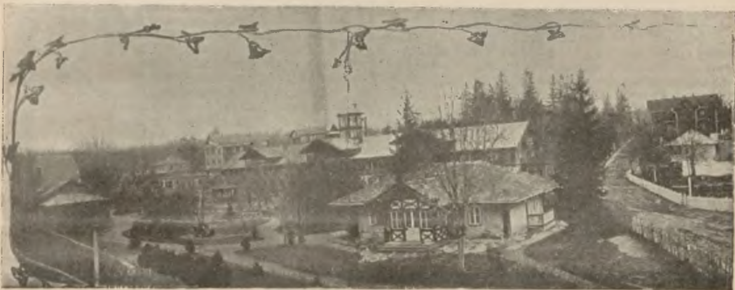
Ogólny widok Truskawca.

Przy zachowaniu tych ostrożności, nie zdarzył się u nas z powodu używania kąpiele żaden nieszczęśliwy przypadek, jeśli zaś kiedy przychodzi do chwilowego pogorszenia się — winę przypisać zawsze trzeba pacjentowi, który swego stanu nie znając a zbyt silom swoim ufając, nadużywa, mimo przestrogi, kąpiele.