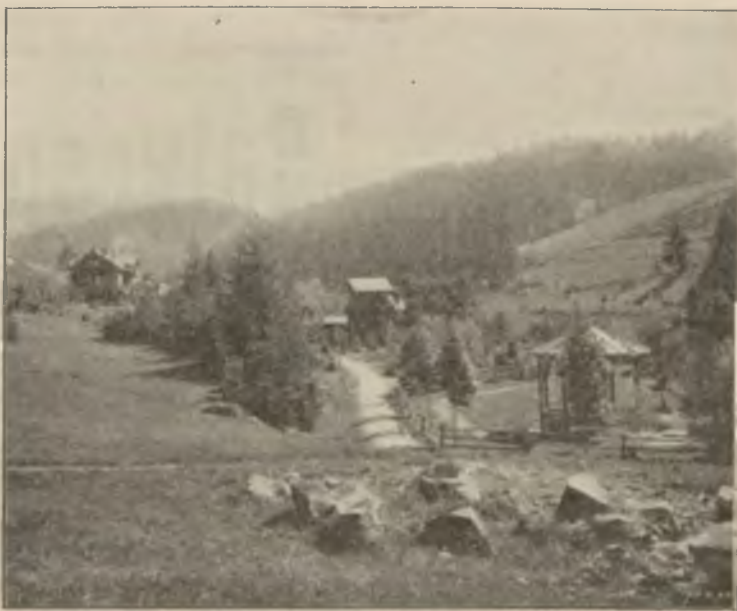
Zdrój „Jozefka“ w Krynicy.

W najbliższym czasie przybyć ma do Krakowa czeski chór z Pra-gi, który po produkcjach w Krakowie w miesiącu czerwcu, uda się do polskich zdrojowisk, by zapoznać naszą publiczność z czeskimi pieśniami. — Z góry zapewnić można, że czeski chór znajdzie wszędzie najlepsze przyjęcie. Osobno wybiera się z Krakowa do Pra-gi, wycieczka uczniów szkół śre-dnich. Pan Hofman,