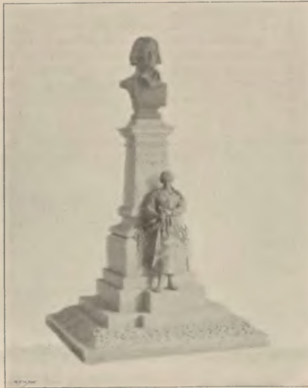
Projekt pomnika A. Mickiewicza w Krynicy. (według pomysłu A. Popiela)

ścielcem nad kotłinią pod Pośrednią Turnią ku ścieżce od Zielonego Stawu na przełęcz Swinnicy; 2) w dolinie Pięciu Stawów ścieżkę, wiodącą od zwykłego szlaku do ścieżki dawniejszej w połowie wysokości na Kozi Wierch. Poprawiono dawniejsze ścieżki: 1) od Zielonego Stawu na szczyt Swinnicy; 2) brzegiem wschodnim od Czarnego Stawu Gąsienicowego do Zmarzłego, a stamtąd do pierwszych klamer na Zawracie; 3) na Kozi Wierch; 4) z Koziego Wierchu ku Zmarzłemu, źlebem, w którym dano kilka łańcuchów i klamer; 5) na Krzyżne i Wołoszyn z doliny Pańszczycy; 6) z przełęczą nad Piekiełkiem na szczyt Giewontu do samego krzyża; 7) ścieżkę przy Siklawie, gdzie poprawiono schody; 8) ścieżkę na Szpiglasach. Naprawiono altany: 1) uszkodzoną skutkiem lawiny pod Miedzianem naprawiono i przeniesiono w inne miejsce; 2) altanę nad Morskiem Okiem uszkodzoną w zimie przez zerwanie dachu naprawiono tymczasowo; należyta naprawa nastąpi w wiosnę. Wreszcie nowych ławek umieszczono 66, a mianowicie w dolinie Białego 11, w dolinie ku Dziurze 3, na drodze z Białego do Strążysk 8, w Strążyskach 15, na dro-