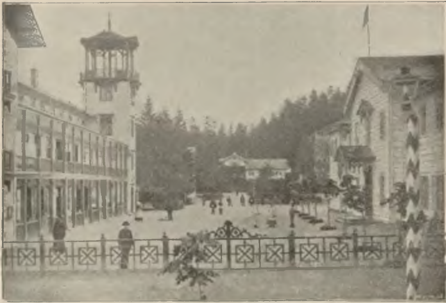
Plac Dietla w Iwoniczu.

excellence“, jakim jest woda, działanie teje wspomagają lub nawet potęgują: z urządzeń takich publiczność może wprawdzie dziś korzystać w każdym większym mieście, w połączeniu jednak z racjonalną hydroterapią tam tylko wybitny skutek wywrzeć właśnie mogą, gdzie sama przyroda, wśród odpowiednich warunków klimatycznych hojną ręką rozsiała swoje dary, ze skarbca naturalnych środków leczniczych zaczerpnie. Na tem też polega wartość przeróżnych podmiejskich Zakładów wodolecznicy, jakie zagranicą prawie każde większe miasto posiada, w których leczy się nietylko wodą samą, lecz wszelkimi środkami terapeutycznymi, obok wody i wspólnie z wodą do usług lecznictwa tam właśnie zaprzęgniętymi, gdzie sama natura niejako ku temu wskazówkę i sposobność daje.