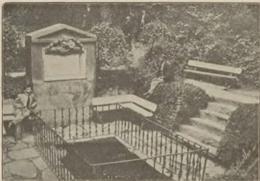
Belkotka w Iwoniczu.

Grono lekarzy lwowskich zwiedziło dnia 21 b. m. zakład zdrojowo-kąpielowy w Morszynie, będący własnością funduszu wdów i sierót po lekarzach.