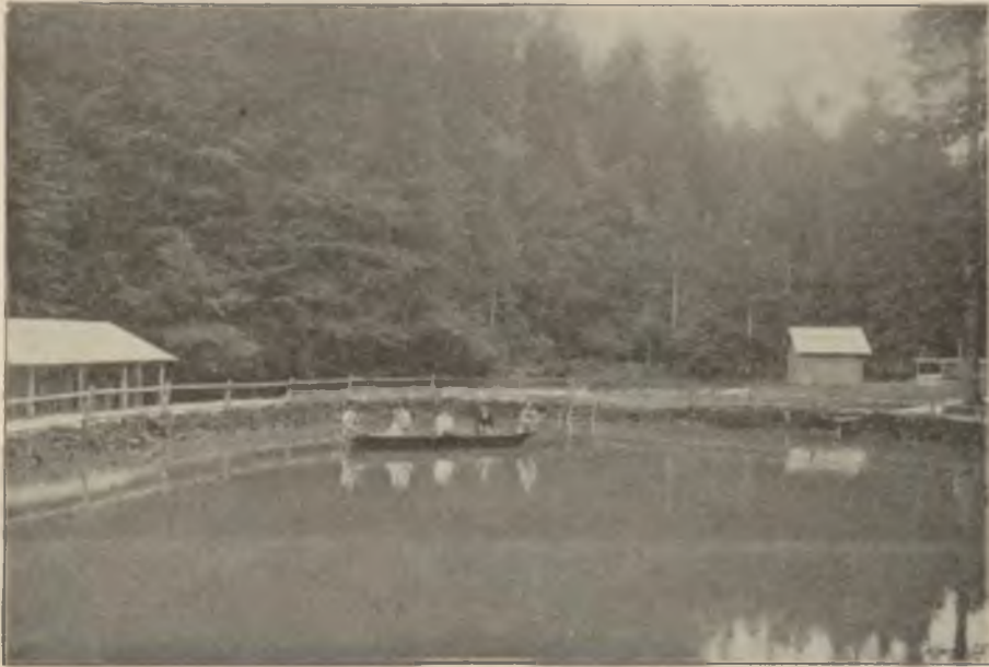
Staw na „Kawalcach“ w Iwonice.

Każdy prawie numer „Krytyki lekarskiej“ pełen jest ważnych i doniosłych wskazań i uwag, dotyczących się nie tylko ważniejszych zadań nauki lekarskiej, ale i zagadnień mających znaczenie więcej społeczno-lekarskie. Między innymi na uwagę zasługuje może niesłusznie w „Notatkach“ (str. 243) umieszczony ze względu na ważność przedmiotu omawianego artykuł p. M. o stosunku