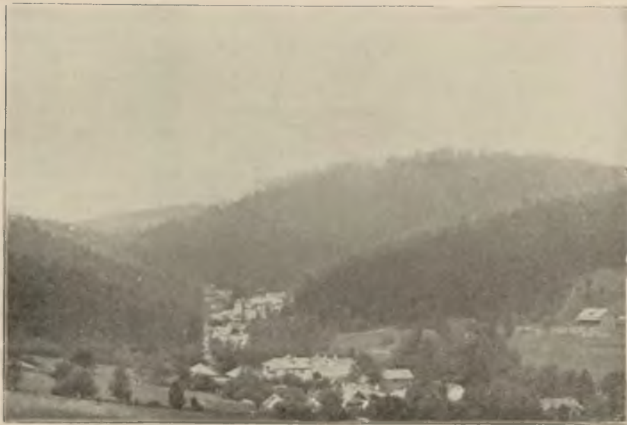
Ogólny widok Iwonicza.

Drugi stylowy budynek, leżący w parku, dom „pod Matką Boską”, nie pozostawia pod względem wygody i komfortu nic do życzenia. Zawiera 30 pokoi, jasnych, czystych, urządzonych nie tylko wygodnie, ale nawet stylowo, (naturalnie w stylu zakopiańskim.) Tutaj też mieszczą się ludzie, których środki materialne pozwalają na większe wygody, tutaj również znajdują się apartamenty po 2, 3 pokoje, do wy-