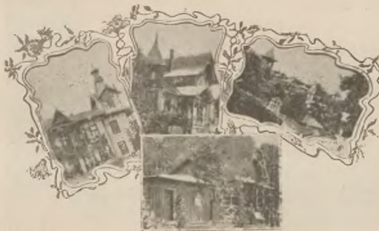
Widoki z Truskawca.