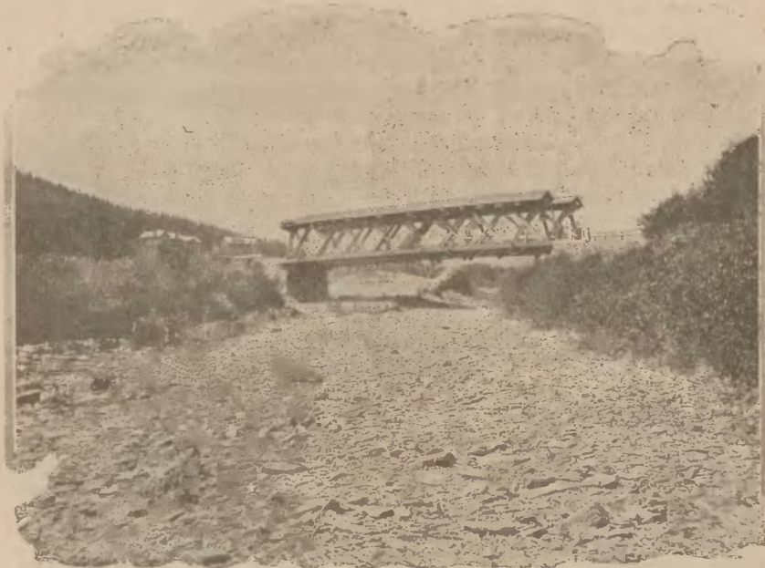
Rymanów-Zdrój: Most kratowy. (System inż. Ibiańskiego).

Teoretycznie da się tą wyższość zdrojowisk uzasadnić tą okolicznością, że nad morzem obok dobrego powietrza leczenie polega tylko na kąpielach słonych, podczas gdy w zdrojowiskach piją nadto chore dzieci wodę mineralną,