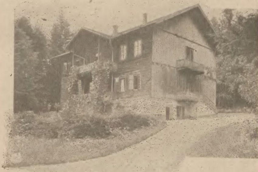
Rymanów-Zdrój: Willa pod Gołębkiem (mieszkanie właściciela Zakładu).

W razie zaniedbania tego obowiązku będą wynajmujący mieszkania pociągnięci do odpowiedzialności przez