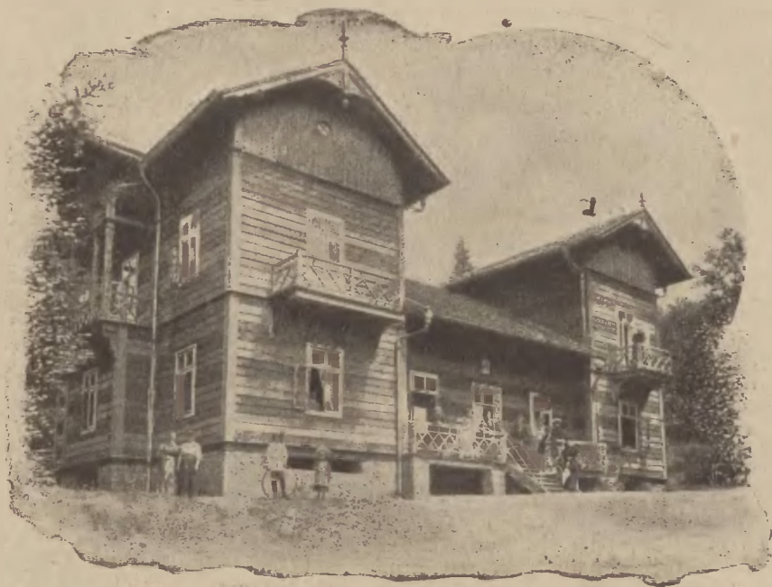
Rymanów-Zdrój: Willa pod Aniołem Stróżem.