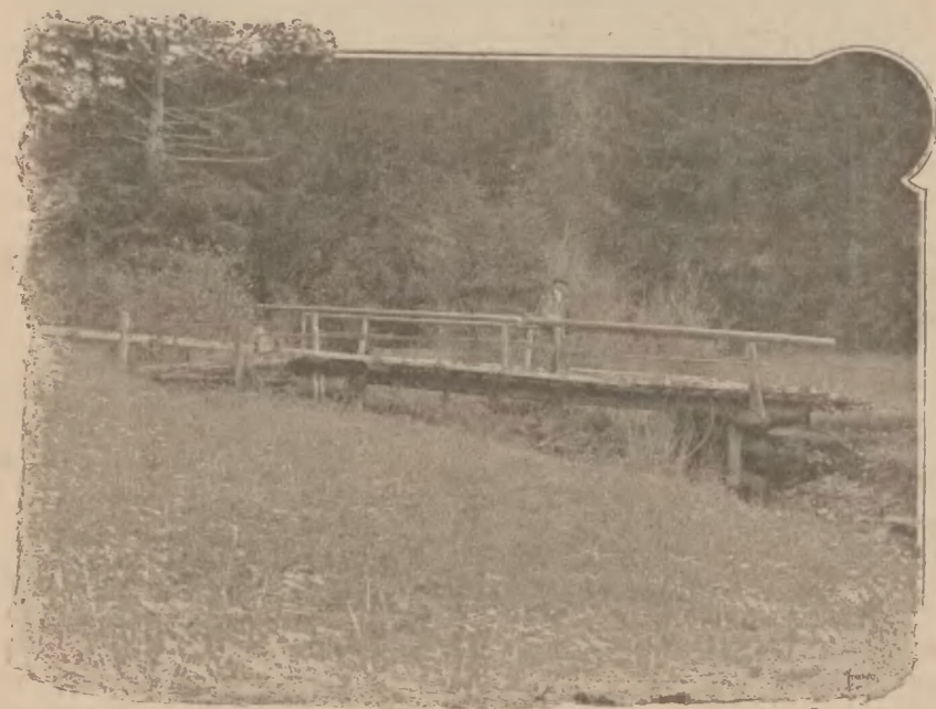
Rymanów-Zdrój: Most w lesie.