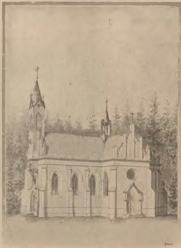
Rymanów-Zdrój: Projekt kaplicy zakładowej w budowie.

W celach leczniczych używa się do picia na miejscu i wywozu wody każdego z tych źródeł.