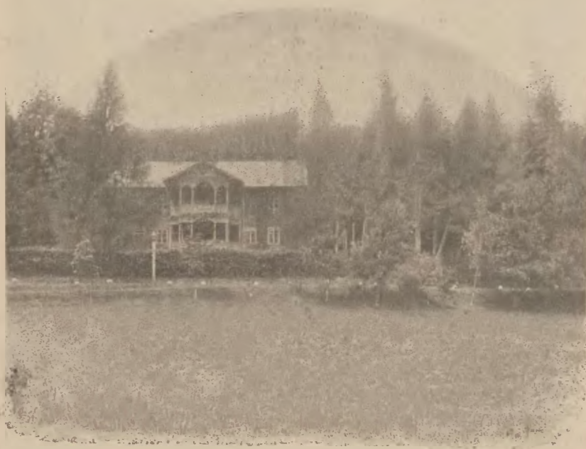
Rymanów-Zdrój: Willa „Opatrzność“

Przyczyną tak krótko trwającego leczenia w kolonii rymanowskiej ma być brak funduszy. Pożądaniem jest ze wszech miar, aby komitet zarządzający tą kolonią energi-