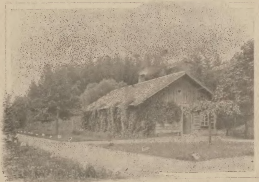
Rymanów-Zdrój: Dom zabawowy. Najstarszy budynek w Zakładzie.

trwa od 20-go maja do 20-go września i dzieli się na 3 sezony: