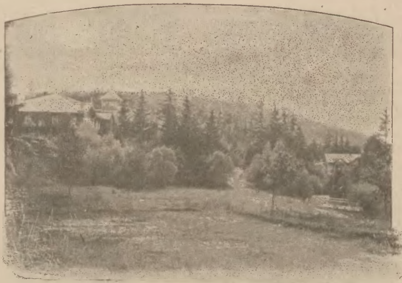
Rymanów-Zdrój: Widok na Zakład od strony tartaku.

W r. 1888 rozpoczęto budowę murowanej kaplicy zakładowej, którą mogła pomieścić znacznie większą ilość osób (900) aniżeli prowizoryczna kapliczka drewniana, pa-