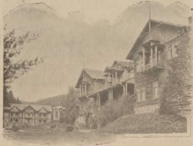
Rymanów-Zdrój: Dworzec gościnny i Willa Lelewa.

Tak się przedstawia w swym dziejowym rozwoju Rymanów-Zdrój — w 30 latach swego istnienia. Że wielkie były braki rzeczy w zdrojowisku niezbędnych, a choćby te, o których nie wspominam, temu nie przeczę. Ale nie