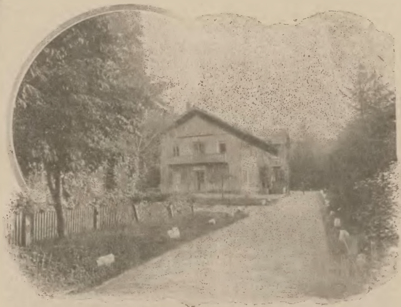
Rymanów-Zdrój: Willa Kościuszki.

Zakłady lecznicze dla gotowych suchotników ze względu na wysokie koszty, z jakimi są połączone, a jeszcze więcej ze względu na wyniki leczenia, jakie u tego rodzaju chorych osiągnąć można, nie mogą przynieść należytej korzyści dla szerokich warstw uboższego, na ciężką pracę skazanego społeczeństwa — muszą z natury rzeczy pozostać czemś zbyt kosztownym. A jestem głęboko przekonany, że jeżeli wszystkie dzieci zółzowe będą odpowiednio leczone —