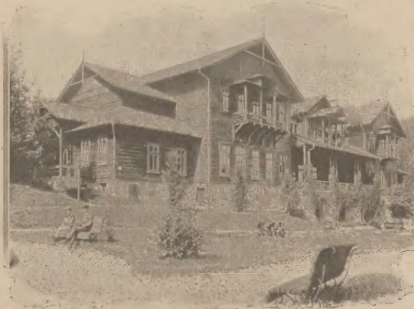
Rymanów-Zdrój: Widok na Dworzec gościnny od strony parku.

Hr. Jan Potocki (Rymanów) sądzi, że należy wykonać mapę Galicyi, poświęconą wyłącznie zdrojowiskom z barwnym przedstawieniem chemicznego składu, cyframi statystyki frekwencji i t. d. Taką wspólną rzecz graficzną należy przedewszystkiem przygotować.