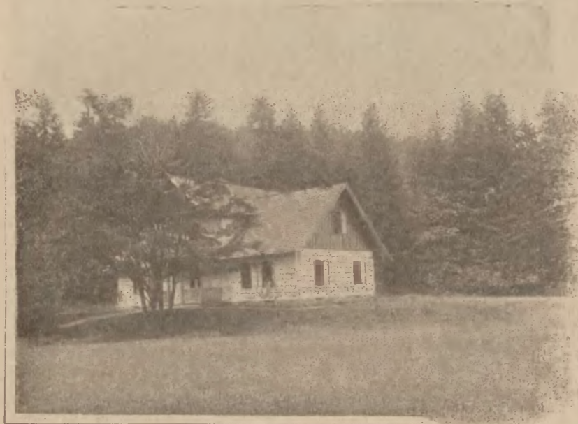
Rymanów-Zdrój: Willa Zacisze.

Kolonia w Rothenfelde wykazuje za ten sam czas leczenia 24% wyleczeń, 52% polepszeń, 23% bez widocznej zmiany.