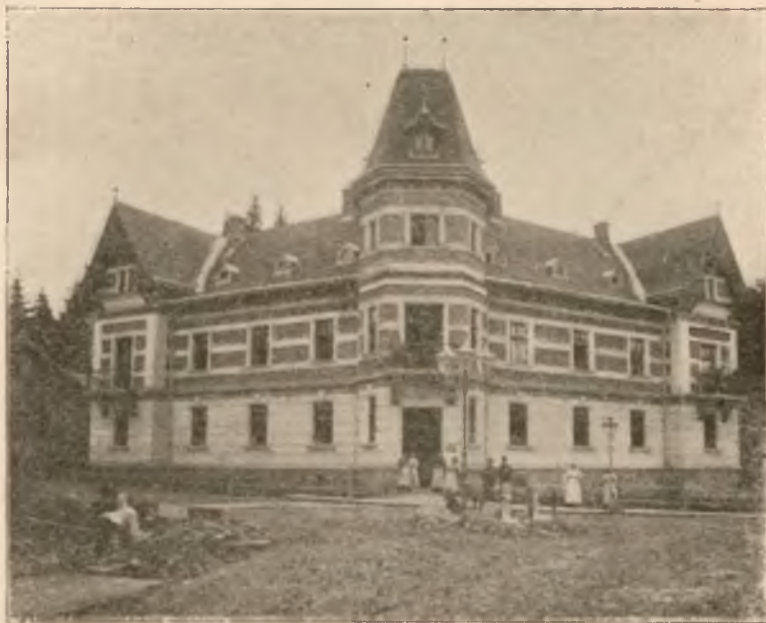
WILLA POD „BERŁEM”.

Od 15-go czerwca osobne bezpośrednie wagony z Krakowa i Lwowa.