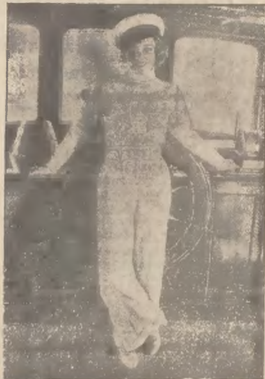
Madge Evans, gwiazda dźwiękowiec amerykańskiego, zdobyła konkurs piękności dla najpiękniejszej podróżniczki morskiej. Temsamem przypad jej w udziale tytuł „Miss Atlantic 1932”.

niezwykle pięknymi typami semickimi. Okryte powłóczytymi białymi strojami płóciennymi, wysokie i gibkie przypominają postacie biblijne i wprost trudno sobie wyobrazić, w jaki sposób umieją zachować swą świeżość i piękność pomimo prymitywnych, niesłychanie ciężkich warunków, w jakich żyją.