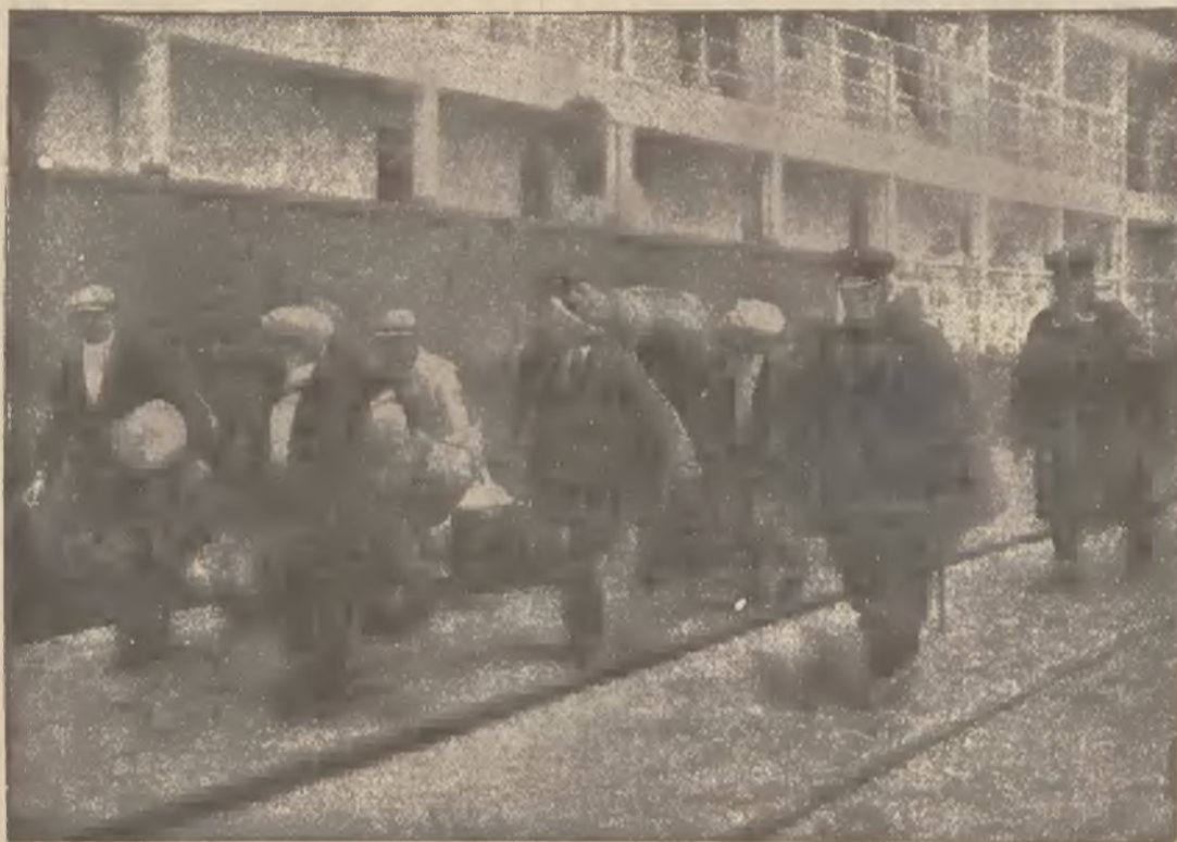
Deportowani obywatele polscy opuszczają „okręt potępieńców” w porcie gdyńskim, eskortowani przez policjantów.

Dodajmy, że całą wygraną sumę wypłacono uszczęśliwionej kobiecie samymi drobnymi pieniądzmi, tak, że musiała wyszukać sobie do nich skrzynkę i odwieźć samochodem do domu,