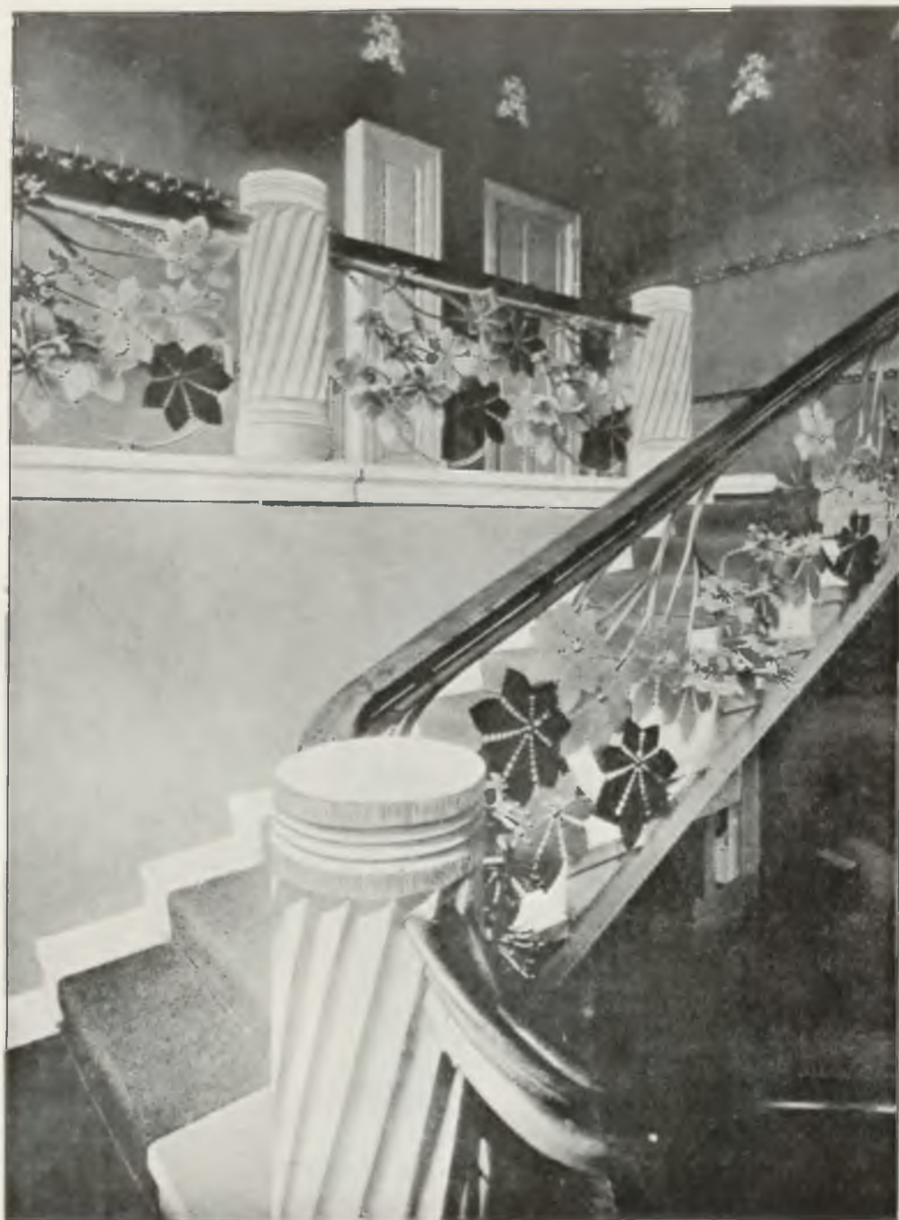
KLATKA SCHODOWA W DOMU TOWARZYSTWA LEKARSKIEGO W KRAKOWIE WEDŁUG PROJEKTU STANISŁAWA WYSPIAŃSKIEGO.