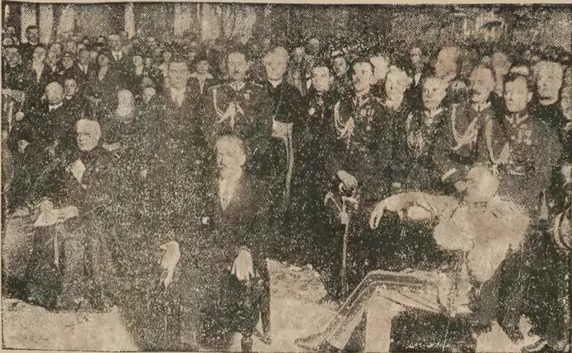
Dnia 13 lutego odbyła się w sali warszawskiej Rady miejskiej uroczystość ku czci Papieża. Od lewej ku prawej siedzą Kard. Lauri, Prezydent Mościcki i Marsz. Piłsudski.