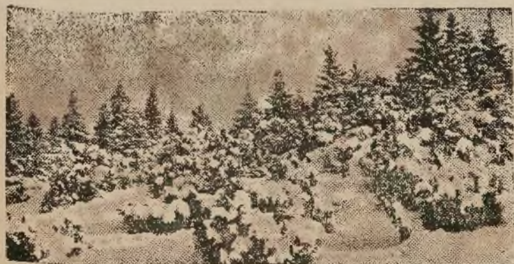
Obrazek na lewo przedstawia piękną miejscowość podkarpacką przykrytą śniegiem.