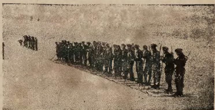
Obrazek na prawo przedstawia 21 dyw. polskiej piechoty górskiej, odbywającą ćwiczenia w Tatrach.