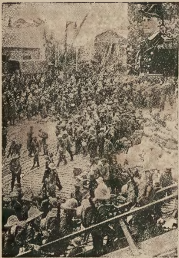
Ładowanie wojska angielskiego do Chin.

CHINY. Coraz groźniejszą staje się sytuacja w Chinach. Armia kantońska, przychylna bolszewikom, znajduje się w marszu na Szanghaj, w któ-