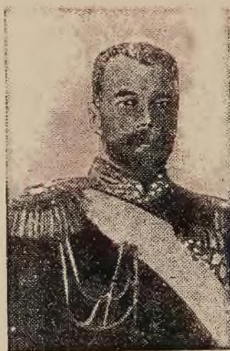
Car Mikołaj II zabity podczas rewolucji przez bolszewików w Jekaterynburgu.