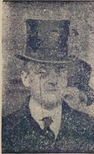
Chamberlain, prezydent ministrów angielskich.