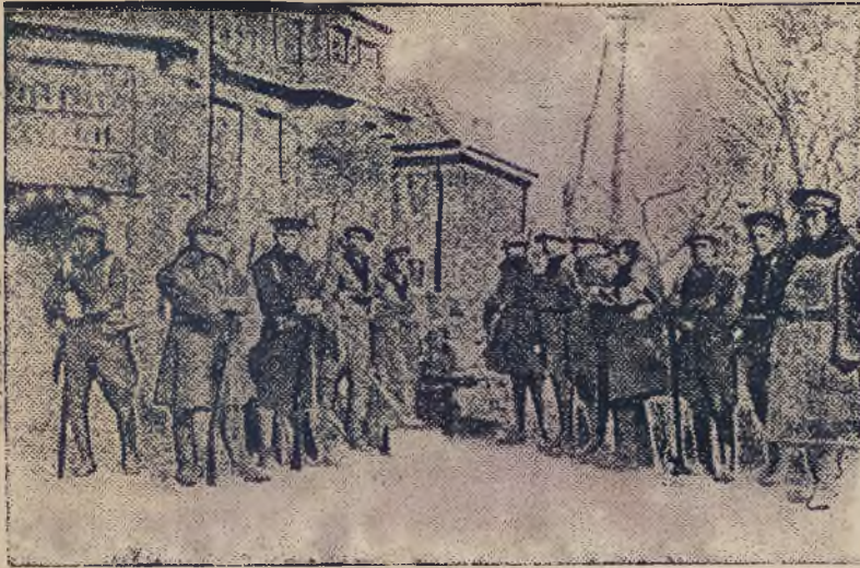
W Szanghaju pełnią służbę porządkową wojska angielskie i amerykańskie, francuskie, włoskie i japońskie pod komendą Anglików.