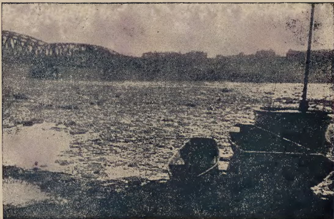
„Na św. Grzegorza — spłynęła Wisła do morza“.

„Wobec tego minister spraw wewnętrznych, jako powołany do czuwania nad wewnętrznym bezpieczeństwem i spokojem Państwa i za nie w całej pełni przed sejmem i społeczeństwem odpowiedzialny, nie mogąc dłużej tolerować tej wrogiej i niebezpiecznej dla Państwa działalności, uznał niezależną partję chłopską za nielegalną.