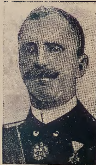
Król Wiktor Emanuel III zwołał naradę rodzinną z powodu naprężonych stosunków między nim a Mussolinim.