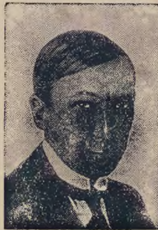
Aleksander Kiereński , premier i głównodowodzący wojskami rewolucyjnymi, główny trybun pierwszej zwycięskiej rewolucji rosyjskiej, która obaliła carat. Kiereńskiego następnie obalili bolszewicy.