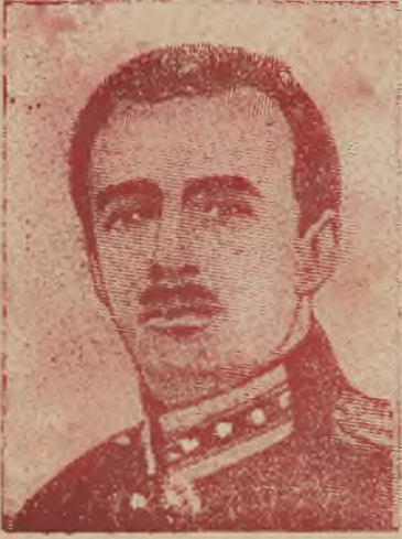
Achmed Zogu Bej, prezydent Albanii z łaski Mussoliniego, znie nawidzonym jest przez ludność.

Niedziela, dnia 10-go kwietnia 1927 roku.