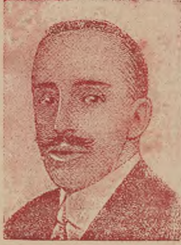
Król hiszpański Alfons XIII, jak donosi prasa hiszpańska, ciężko zachorował i jest nieprzytomnym.

filar b. rządu Witosa, słynny ze spekulacji finansowych, za które został uwięzionym.