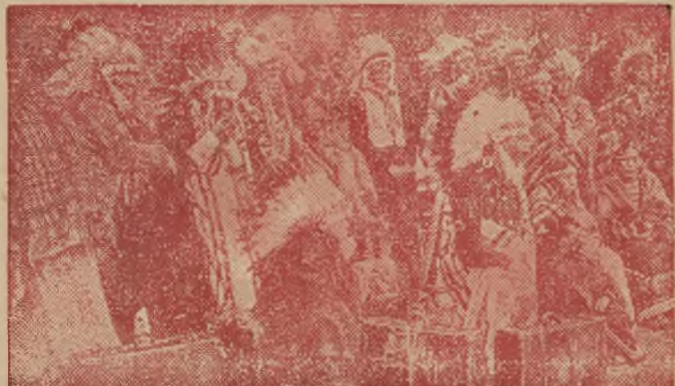
Rycina nasza przedstawia ludjan amerykańskich ze szczepu Siuxów — produkujących się w Europie jako cyrkowcy , występując w nadzwyczaj malowniczych strojach .