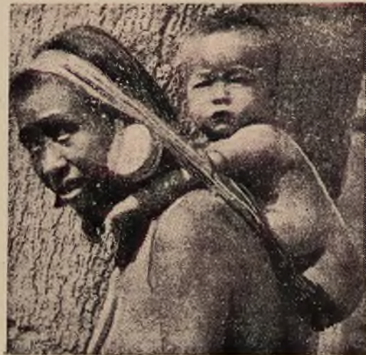
Co kraj to obyczaj. Na obrazku widzimy indjanke w Ameryce południowej noszącą dzieci na plecach na siedzeniu umocowanym na głowie.

KTO CENI SWE ZDROWIE i nerwy, komu zależy na trwałości i oszczędności obuwia, kogo zachwyca chód spokojny, elegancki i elastyczny, ten będzie nosić tylko obcasy i zelówki gumowe „Bersona”.