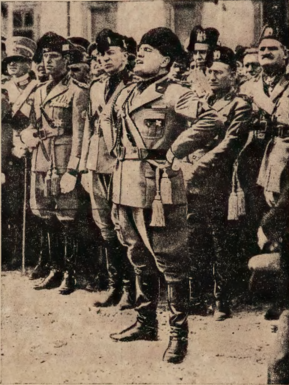
Dyktator Italji Mnssolini stara się ntrzymać swą popularność zapomocą częstych parad, świąt i mów, gdyż nędza w Italji coraz groźniejsza. Obrazek nasz przedstawia Mussoliniego, ubranego w strój wodza faszystów przemawiającego na jednej z licznych parad.