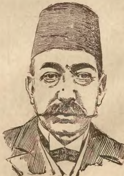
Książę Mehmed Resad następca tronu tureckiego.

Na to przytoczymy przedewszystkiem kilka słów uczzonego francuskiego Jakóba Russo, który w jednym z dzieł swoich mówiąc o przyczynach upadku Polski i jej odrodzeniu w przyszłości tak pisze: