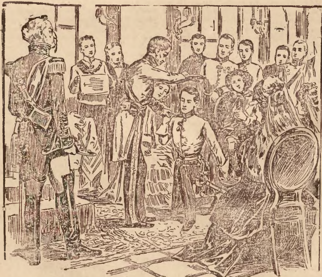
Jubileusz cesarza austriackiego Franciszka Józefa I.

Obrazek przedstawia chwilę, gdy w roku 1849-ym dnia 2-go grudnia cesarz austriacki Ferdynand składa koronę, a następcą swym mianuje, i na dalsze życie błogosławi siostrzeńca swego, obecnego cesarza Franciszka Józefa.