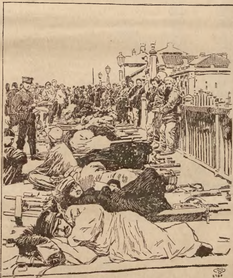
Transport rannych Japończyków na stacyi w Mandżurji.

Lekarze wiele już podjęli usiłowań, aby zbać istotę suchot i wynaleźć środek ku zwalczaniu