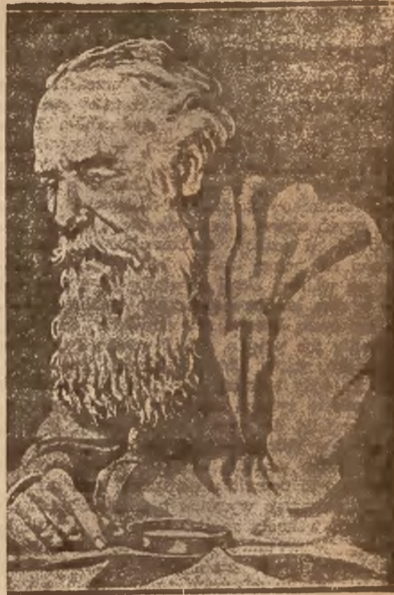
W ostatnich dniach obchodził Pasic, premjer królestwa SHS., którego portret wyżej podajemy, 80-tą rocznicę urodzin.

ctwie, dzięki której spodziewa się bezwzględnego unikania strejków. Bardzo ciekawym i charakterystycznym dla całej mentalności Mussoliniego jest uzasadnienie, jakie przytoczył on dla zadania decydującego ciosu teorii klasowej Marksa, przynajmniej na gruncie włoskim. „Uważam, że naród włoski jest w stanie stałej wojny. Jak w czasie wojny nie były dopuszczalne zatargi w fabrykach i ciała arbitrażowe je łagodziły, tak również i obecnie musimy zdążyć do realizacji największej wydajności bogactwa narodowego. Albowiem następną pięć, czy dziesięć lat rozstrzygać będą o losach naszego narodu”.