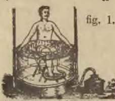
Handhabung d. Apparats.

Aparatem tym można robić kąpiele parowe całego ciała (fig. 2), połowy ciała (fig. 3) i nóg (fig. 1)