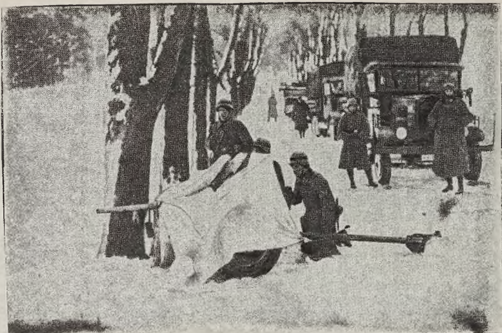
Wojska garnizonu królewieckiego podczas ćwiczeń wojskowych w śniegu.

W kołach astronomów całego świata już od 25 października panowało duże napięcie, ponieważ między tym dniem, a 30 października, planeta zbliżała się szybko do kuli ziemskiej. Prawdopodobnie zjawisko te zdarzyło się już przed tym, nie było jednak możliwe przed zastosowaniem fotografii w astronomii dokładnie określić tego rodzaju ruchu planet. Dr. Wood pisze w swym sprawozdaniu: „Gdyby planeta wpadła na kulę ziemską, to sytuacja międzynarodowa uległaby istotnie zmianie.”