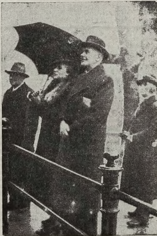
Jugosłowiański premier ministrów Stojadinowitsch przybył do Berlina, gdzie został serdecznie przyjęty