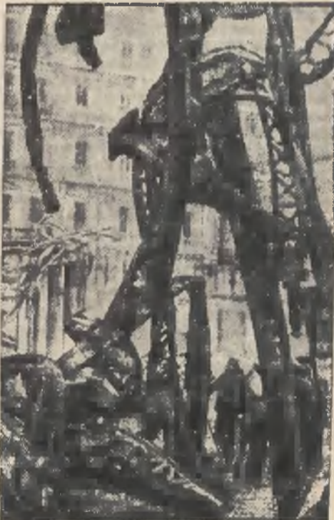
Zgłęszcza jednego z domów, który zatonął w Maszynie.