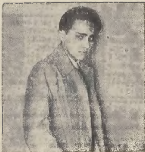
Herszel Grynszpan, który dokonał zamachu rewolwerowego na sekretarza ambasady niemieckiej w Paryżu.