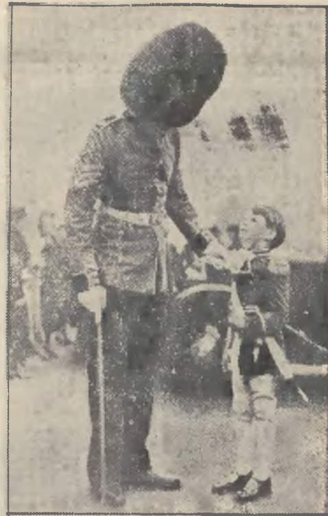
Miły obrazek z przed pałacu Buckingham w Londynie.

Min. Goebbels podkreślił w swym wywiadzie, że zarówno kontrybucją, jak i nowe zarządzenia dotyczące będą jedynie Żydów-obywateli niemieckich.