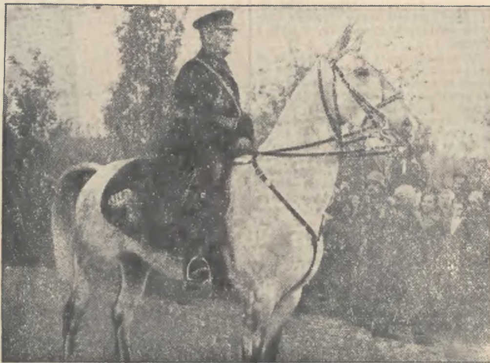
Regent Horthy wjeżdżający do miasta Komarna, zajętego przez wojska węgierskie.