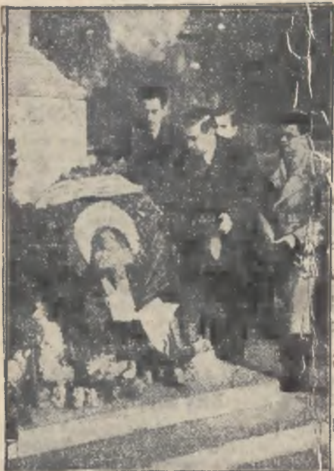
Delegacja Arabów palestyńskich, która przybyła obecnie do Londynu, składa wieniec na grób niezanego Żołnierza.