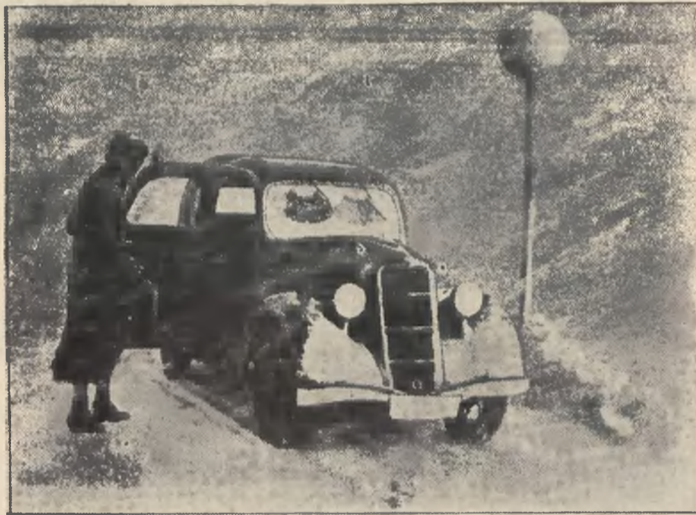
W Szkołki szalała w ostatnich dniach wielka burza śnieżna. Zaskoczeni przez nią w drodze automobilści mieli wskutek tego wiele kłopotów.

Rozważania w dwudziestolecie niepodległości urywamy ze wzmożoną wiarą w naród, wzmożoną troską o państwo.