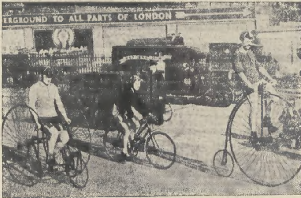
W dniu otwarcia londyńskiej wystawy motocyklowej i rowerowej, odbyły się pokazy jazdy na starożytnych wehikułach kolarskich.

Garść tych faktów wskazuje, że umowa polsko-niemiecka w sprawie robotników sezonowych z 1927 r. nie jest respektowana. Należy pamiętać, że polskich robotników sezonowych jest w Niemczech około 60 tysięcy.