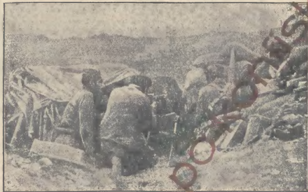
Z walk nad rzeką Ebro w Hiszpanii

zy przymusu. Odnosnie do Wodza naczelnego