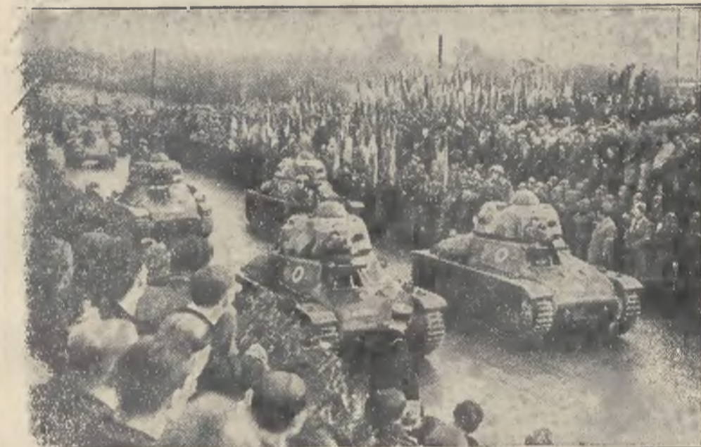
W miejscowości Haudroy we Francji, czyli tam, gdzie przed dwudziestu laty parlamentariusze niemieccy przekroczyli linie sprzymierzonych, odbył się uroczysty obchód połączony z defiladą oddziałów wojskowych.

Nie mamy powodu żałować p. Sławka. Ale istotnie był on b. wybitnym przedstawicielem obozu pomajowego i jego los ogólnie kontrastuje z zapewnieniami o zwartości tego Obozu.