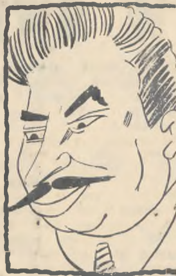
Stalin w karykaturze.

„Słowo” w artykule, poświęconym gen. Ze-