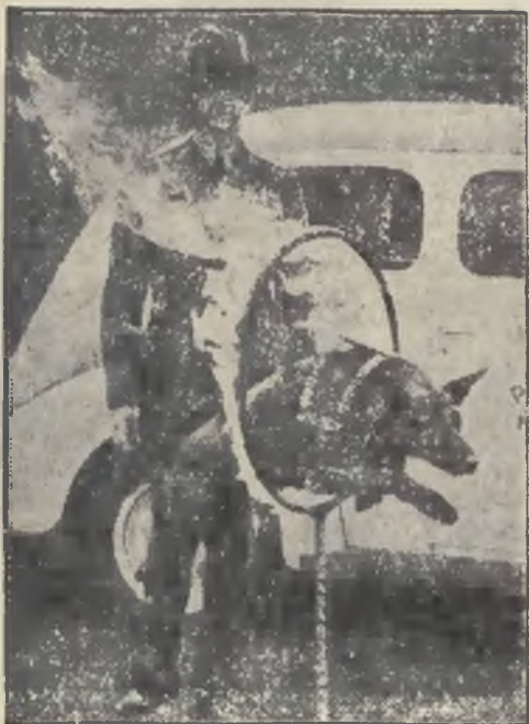
Z popisów psów policyjnych w Madrycie.

W jednym z domów arabskich we wsi Majdał wydarzył się wybuch dynamitu, wskutek czego budynek został zmieciony z powierzchni ziemi. Pięciu Arabów poniosło śmierć.