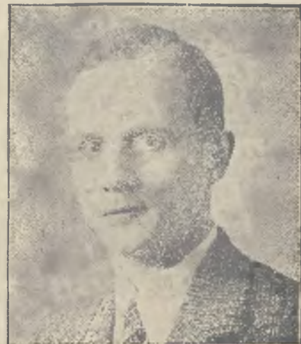
Sekretarz ambasady niemieckiej w Paryżu von Rath.