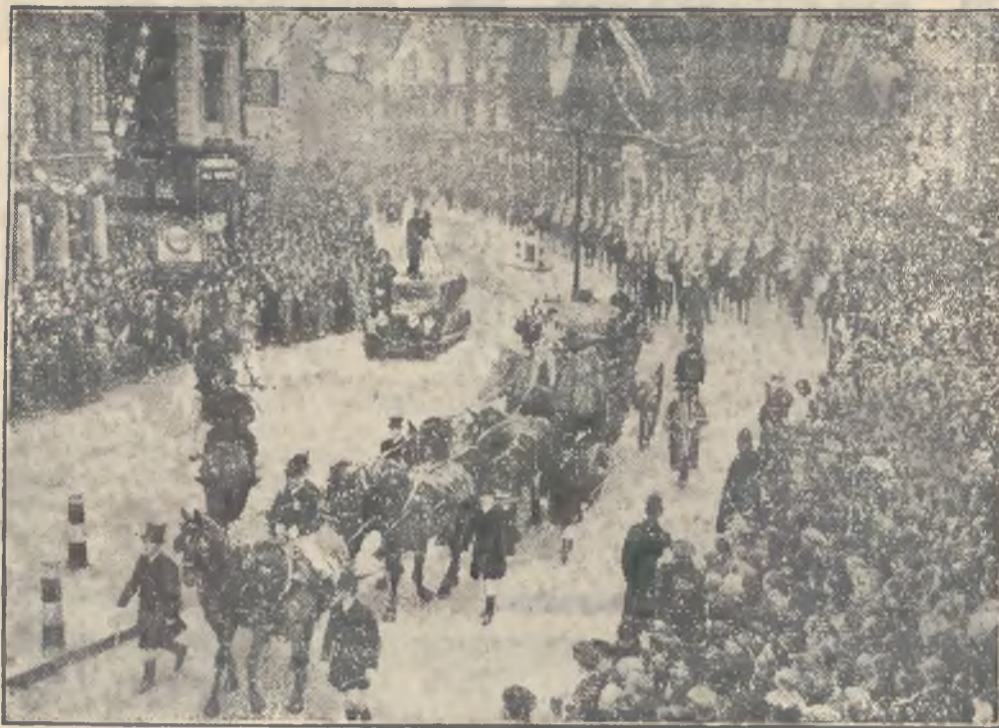
Fragment z uroczystego wjazdu burmistrza Londynu do City.

Poznajcie nasze sztandary, poznajcie naszą prasę, poznajcie nasze zmagania. Wielu okłamywało Was, gdy czytałem prasę, jaką Was karmiono powtarzam: wielu okłamywało Was! Chłopi! Otwieram oczy... Med.