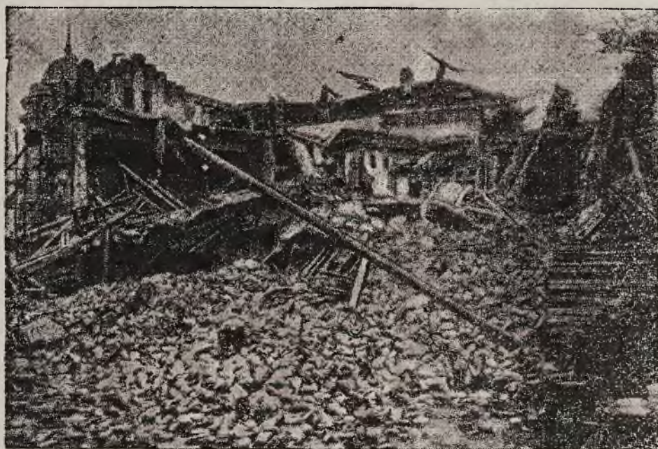
Trzęsienie ziemi w Grecji pochłonęło, jak wynika z dotychczasowych obliczeń przeszło 200 ofiar w ludziach. Poczyniło również znaczne spustoszenia w budynkach. W gruzach legły trzy miasta. Wstrząsy nie oszczędziły portowego miasta Salonik. Na ilustracji widzimy kompleks domów w gruzach w Salonikach.