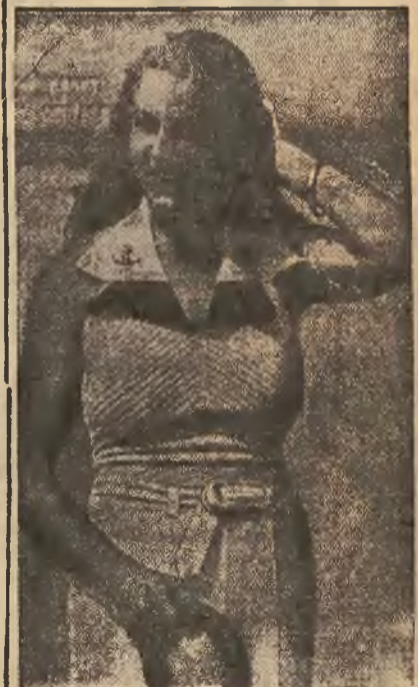
W słoneczny dzień nad jeziorem.

Puder ten spreparowany jest nowym, zadziwiającym sposobem. Jest on tak lekki, że utrzymuje się w powietrzu. Oto nowy „Eteryczny” Puder Tokalon. Puder ten jest niewidoczny na twarzy. Nie czyni wrażenia „maquillage'u”, lecz nadaje naturalne piękno. Nie zawiera siarnistych cząstek, które drażnią pory, tworząc wagi lub plamy. „Eteryczny” Puder Tokalon przylega do skóry w ciągu 8-u godzin. Kładzie on kros tustej, świecącej skóry i polyskowi nosa. Nie należy się już więcej zbyt często pudrować! Ani deszcz, ani wiatr lub posadne się nie separują świeżej cery, którą puder ten nadeje. Osiągnij dziś jeszcze fascynujące piękno przez zastosowanie „Eterycznego” Pudru Tokalon. W razie niezadowolonia — zwrot pieniędzy.