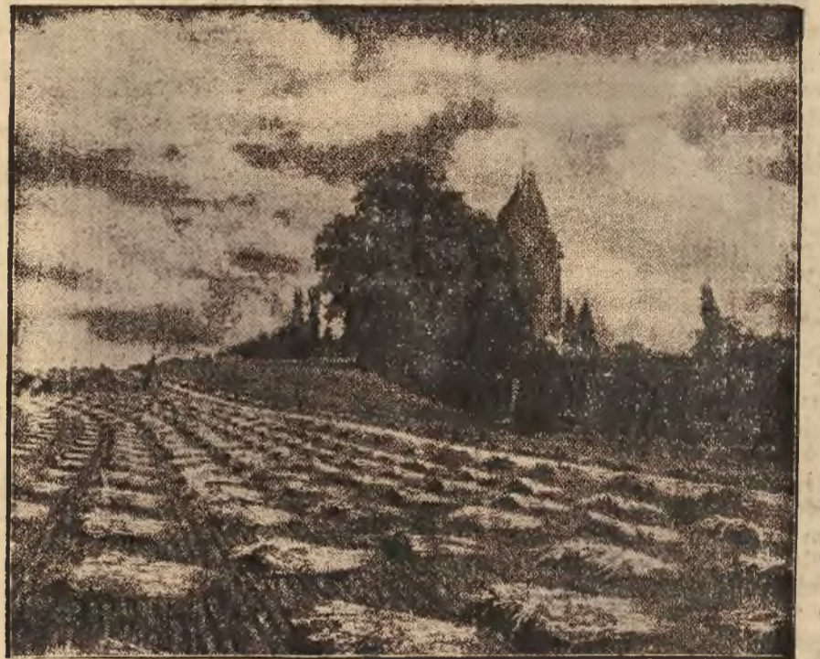
Na zdjęciu widzimy stary kościół, położony malowniczo wśród uprawnych pól.