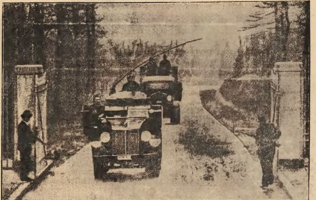
Na zdjęciu widzimy przewóz pod eskortą 400 milionów dolarów w złocie do twierdzy Fort Knox w Stanach Zjednoczonych A. P.