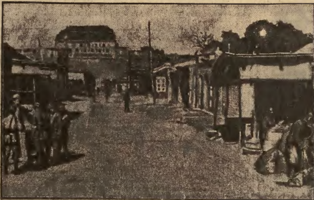
Nasze zdjęcie jest jednym z pięćdziesięciu zdjęć, nadesłanych z chińskiego frontu walki i przedstawia wojska chińskie podczas budowy barykad na ulicach miasta Youan Ping (Chiny Północne).