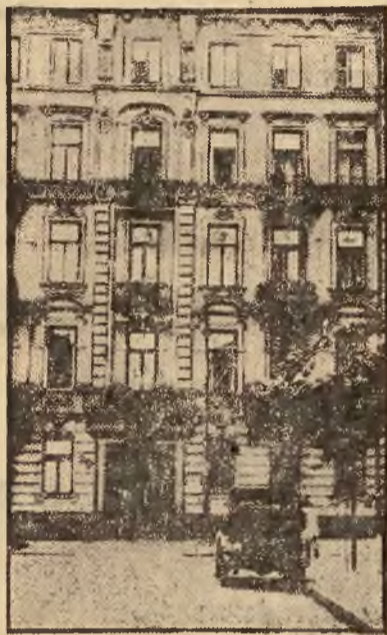
Piękny dom przy ul. Skorupki 12, w którego wnętrzu kryje się mieszkanie - grób sędziwych staruszek.

Otóż praprababka i prababka mieszkają w tym grobie za życia od osiemnastu lat(!). Od osiemnastu lat więc nie widują