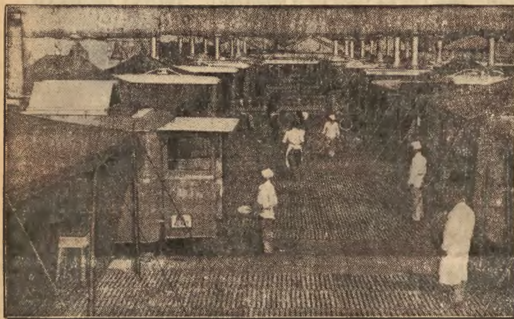
W Norymberdze, gdzie odbędzie się zjazd partii narod.-socjal. w Niemczech, czynione są gwałtowne przygotowania kulinarne. Trzeba będzie bowiem dostarczyć jedła dla 1½ miliona osób.