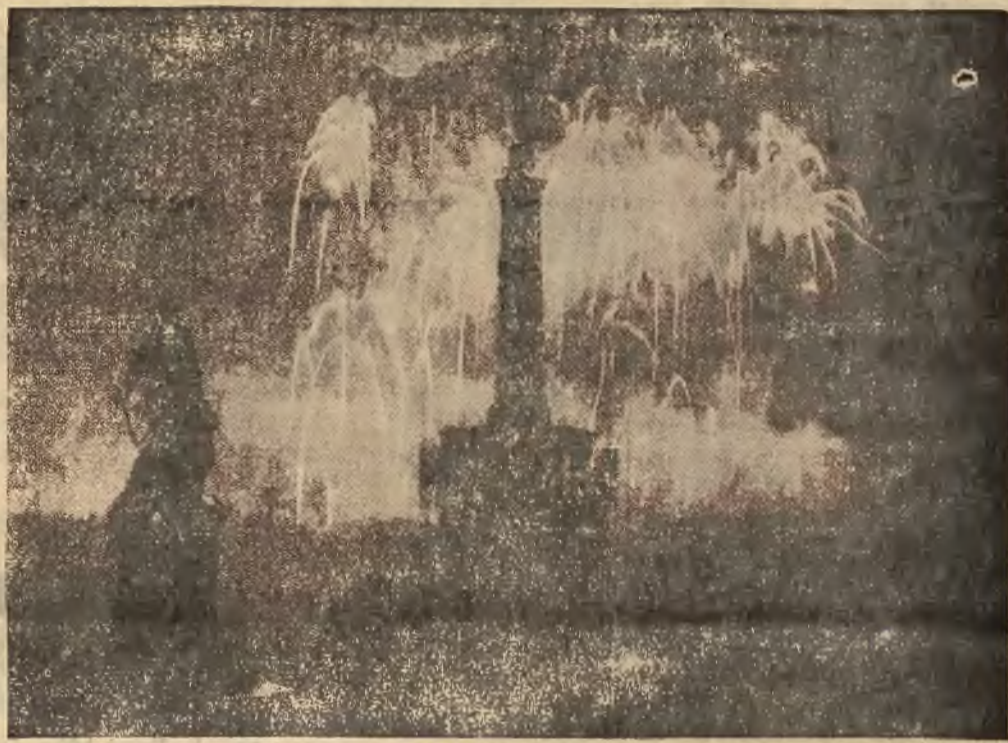
W czasie uroczystości, związanych z 700-leciem Berlina, duże wrażenie wywołała iluminacja królewskiego placu oraz Reichstagu.