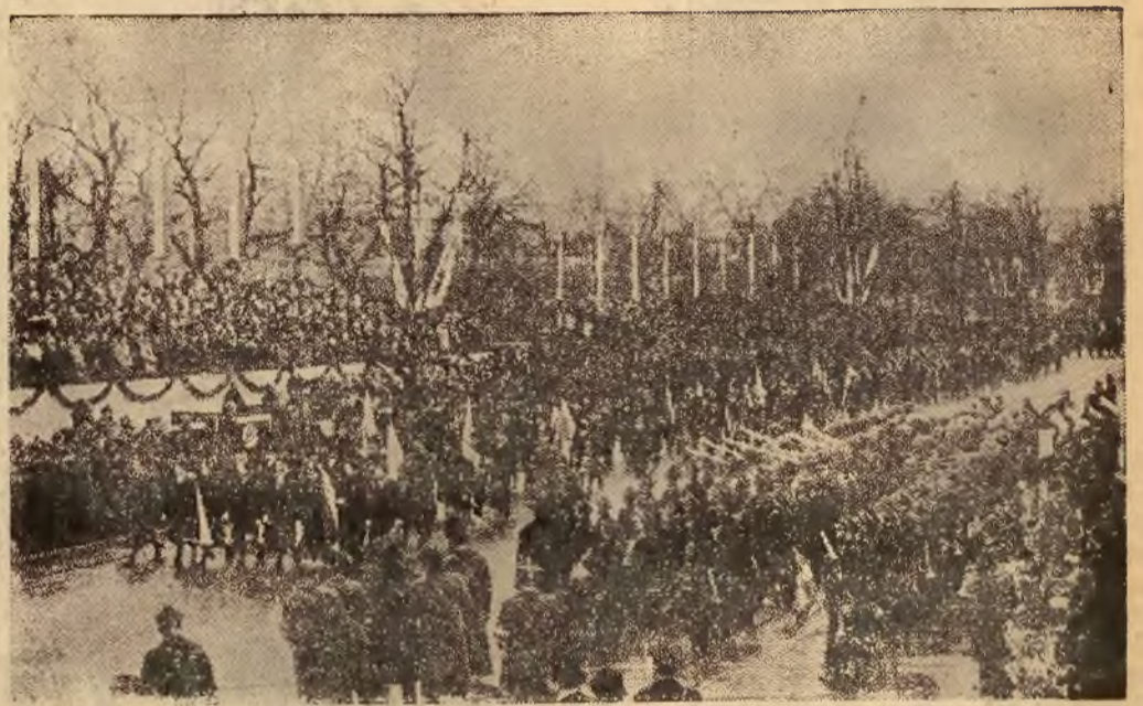
Fragment z defilady organizacji młodzieżowych ze sztandarami przed Naczelnym Wodzem.