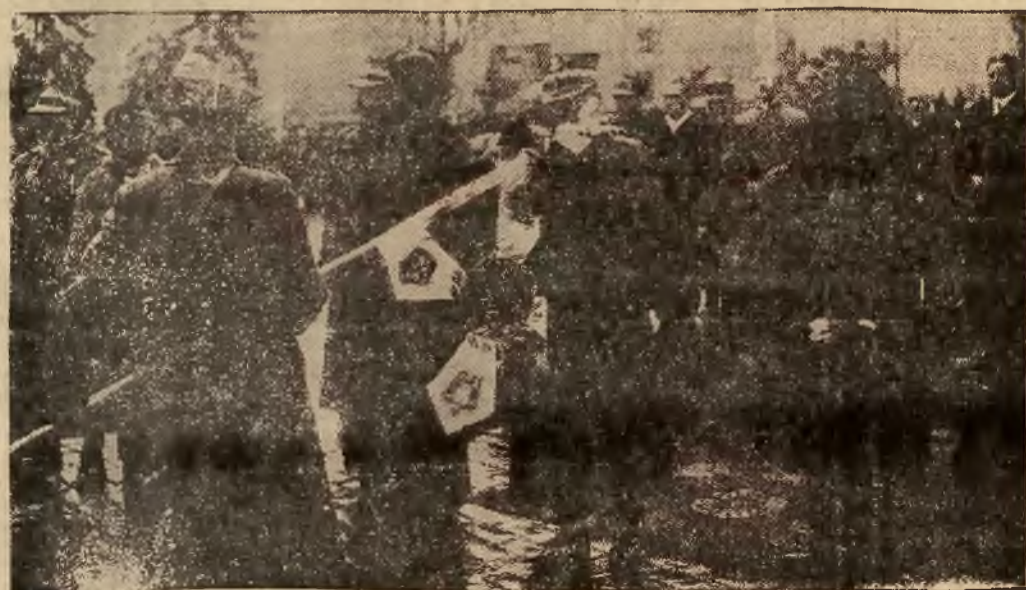
Moment przypinania przez Marszałka Śmigłego Rydza na sztandarze wileńskiego pułku artylerii krzyża „Virtuti Militari”. Przy sztandarze widzimy Panią Marszałkową Piłsudską, zaś obok na prawo Pana Prezydenta R.P.