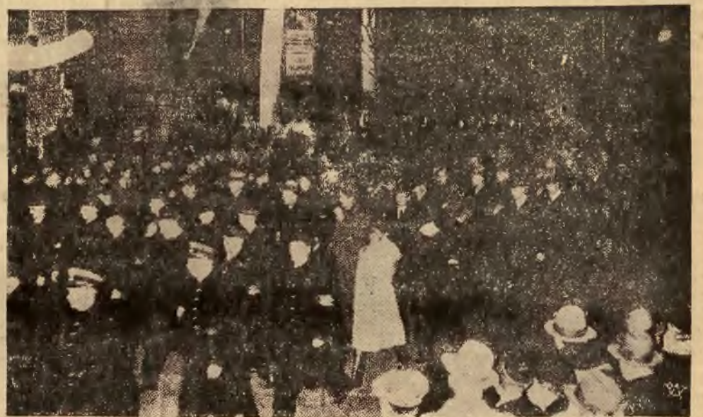
Tysięczne rzesze Warszawy, defilujące w kierunku Belwederu, dla oddania hołdu Marszałkowi Piłsudskiemu, przed domem przy ul. Moniuszki Nr. 2, w którym w 1918 r. mieszkał po swym powrocie z Magdeburga Marszałek Piłsudski.