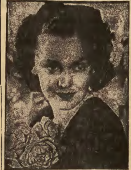
Maureen O'Sullivan dziewczę z Irlandii