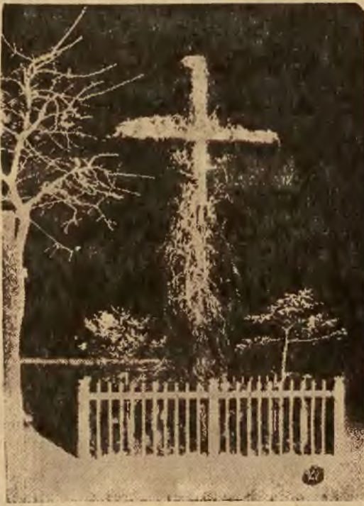
Krzyż Traugutta na stokach Cytadeli Warszawskiej.