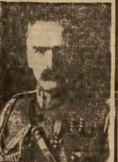
nicy Imienia Marszałka Józefa Piłsudskiego. Przemówienia tego oczekuje cała Polska w wielkim skupieniu.