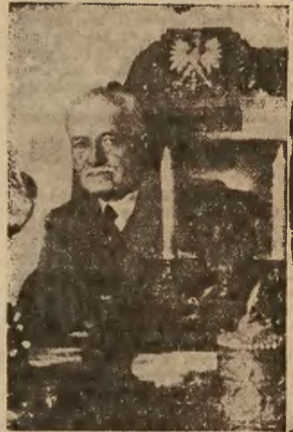
P. Prezydent Rzeczypospolitej prof. Dr. Ignacy Mościcki wygłosił na Zamku Królewskim, transmitowane na wszystkie radiostacje polskie przemówienie, które poświęcone będzie 4 rocz-