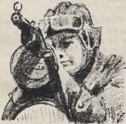
Sowiecki motocyklista z pistoletem maszynowym

łóż Niemcom, a nawet zadać im potężne ciosy, robiące wrażenie zwrotnego punktu wojny.