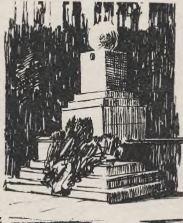
Obelisk ku czci Kościuszki w Zuchwil (Solura)