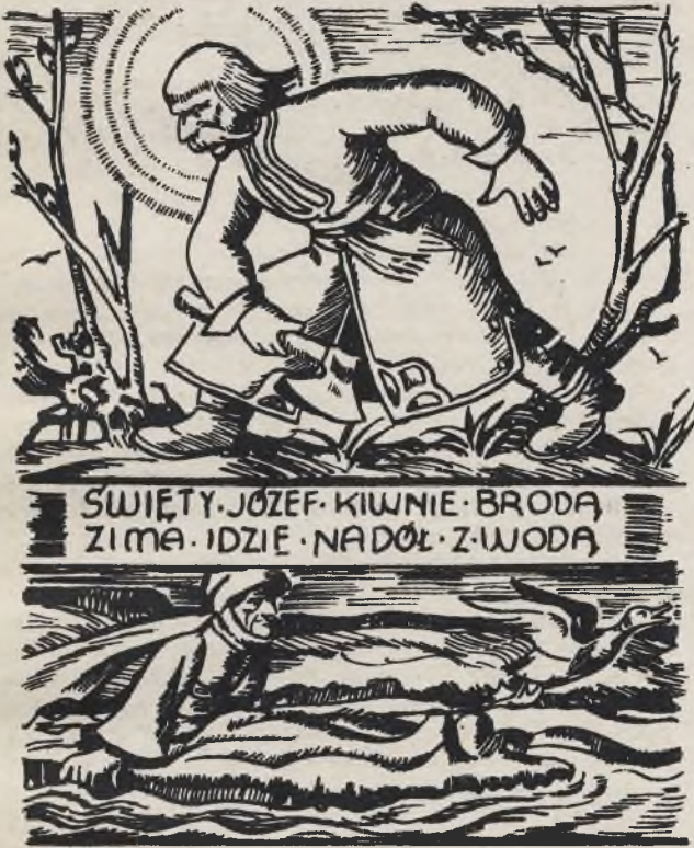
Przystawie polskie w ilustracji