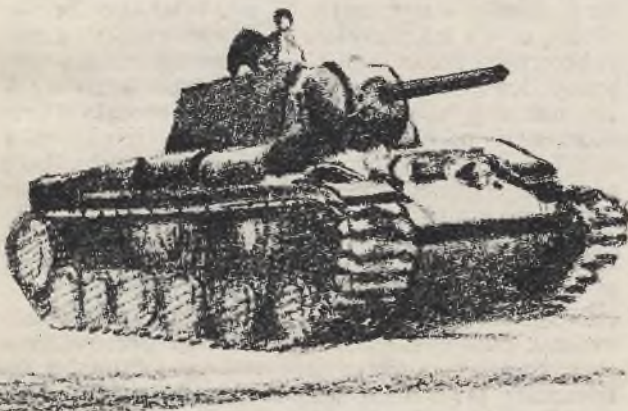
Czołg „Klim Woroszyłow“

Powyższe zestawienie nie uwzględnia jeszcze różnej innej broni, jednakże sami Niemcy uznają wysoką jakość sowieckiego uzbrojenia, z jedynym wyjątkiem co do samolotów. Oczywiście przy ogólnej ocenie sowieckiego wysiłku wojennego należy wziąć w rachubę, że bardzo pokaźną ilość broni i innego sprzętu otrzymał ZSRR od Wielkiej Brytanii i Stanów Zjednoczonych. Szczególne znaczenie bojowe posiada przeprowadzona w ogromnie trudnych warunkach morskich dostawa przeszło 3000 czołgów (jest to siła 10 dywizji pancernych) oraz ponad 4000 samolotów, czyli około 300 dywizjonów.