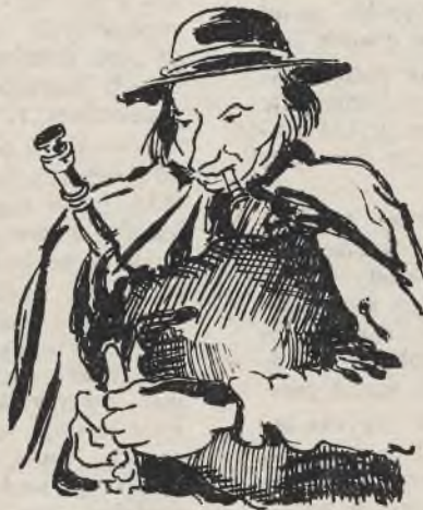
Kobziarz z Poronina (wg Jarockiego)

— »Essener National-Zeitung« donosi z tzw. Warthegau o licznych wypadkach krnąbrności Polaków, karanej »twardo ale sprawiedliwie«. Przeciwno wszystkim, otwarcie lub skrycie działającym przeciwko Niemcom, występuje się z całą surowością. Tak więc pewien Polak z »Trutzberg« w okolicy Włocławka, pracujący u rolnika, okazywał opieszałość w pracy i niechęć. Jednego razu miał onjechać na stację, a gdy niechętnie i opornie wykonywał otrzymany rozkaz, gospodarz zaś popędzał go do pośpiechu — Polak rzucił się nań, dusząc go i tylko z trudem zdołano go oderwać od ofiary. W innym wypadku służąca-Polka z okolic Środy, która wielokrotnie sprzeciwiała się swej go-