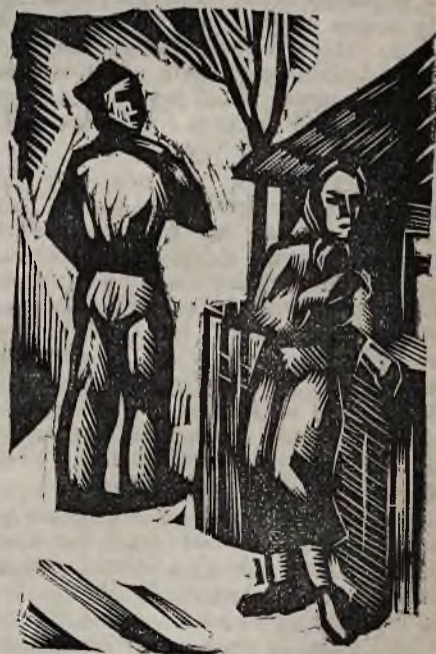
Tuliła się do parkanu; by mnie ominąć...