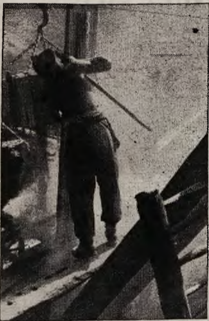
Przy odbudowie zniszczonych lawina domów w Gurnellen

Widziałem jak się litery układa w lamy (szpalty), literę po literze, i ile razy drukarz musi sięgnąć do płaskiej skrzynki z literami, zanim złoży jaki artykuł, z jaką uwagą musi to czynić, by uniknąć błędów. Pomyślałem sobie, że już wolę pracować ciężko u ogrodnika jak w tej redakcji.