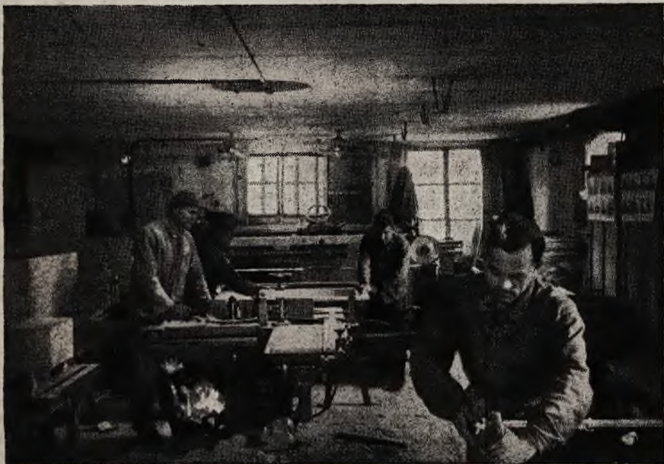
...ze starej obory urządzono wcale przyzwoite pomieszczenie na warsztat stolarski

Poważne miejsce w pracach warsztatu zajmują zabawki dziecięce, jak toczące i ręcznie malowane chrabąszcze, pomysły kołyski dla lalek, zachwyty i strach wzbudzające u dzieci ruchome węże, barwne lalki huculskie, motyle, zabawne — też ręcznie malowane — kaczkę, konie, drabinki z pajacami itp. Przedmioty te cieszą się wielkim popytem u Szwajcarów. W Bernie na głównej ulicy prze-