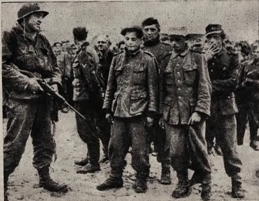
Mała gromadka z wielomilionowej rzeszy jeńców z byłego, niegdyś tak potężnego „Wehrmachtu“

Na zapytanie, czy jej zdaniem kobiety powinny brać bezpośredni udział w walce, Polka odrzekła: „... W Polsce nie było innego wyboru, jak tylko walczyć. Naszych mężczyzn nie było w dostatecznej ilości, więc musieliśmy zająć ich miejsce.“