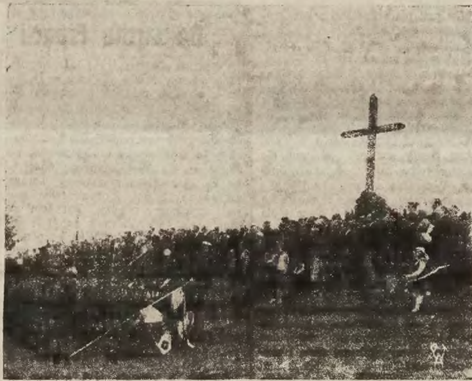
Zdjęcie przedstawia uroczysty moment składania wieńca pod krzyżem Romualda Trauguta na terenie dawnej Cytadeli.