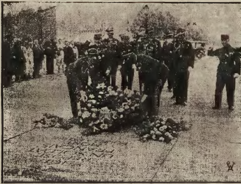
Oficerowie polscy w Centrum Wyższych Studiów Wojskowych w Warszawie, przybyli z wycieczką do Paryża, składają wieńce na grobie Nieznanego Żołnierza w obecności gen. Knolla i płk. dypl. Bleszyńskiego, attache wojskowego przy ambasadzie Rzeczypospolitej w Paryżu.