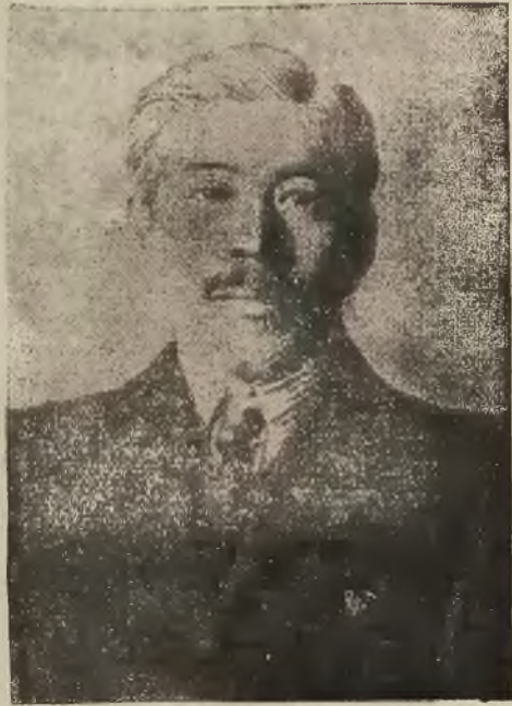
Zmarły w Warszawie poseł japoński Hirojuki Kawai.