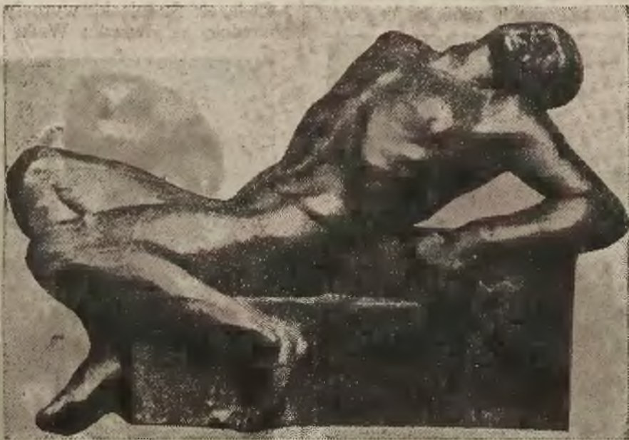
Pomnik poległych żołnierzy P. O. W. dłuta prof. E. Wittiga.

ra — to cegiełka podwalin naszego zbiorowego czynu. Działajmy we własnych szeregach, idźmy do bliskich nam duchem i ideą, nie pozostajmy obojętni dla żadnych poczynań Komitetu. Jak ongiś, przed laty, naszą pocztą peowiacką zdołaliśmy dotrzeć do każdego zakątka i każdego czującego serca — tak dziś niech listy składkowe trafią wszędzie, niech apel Komite-