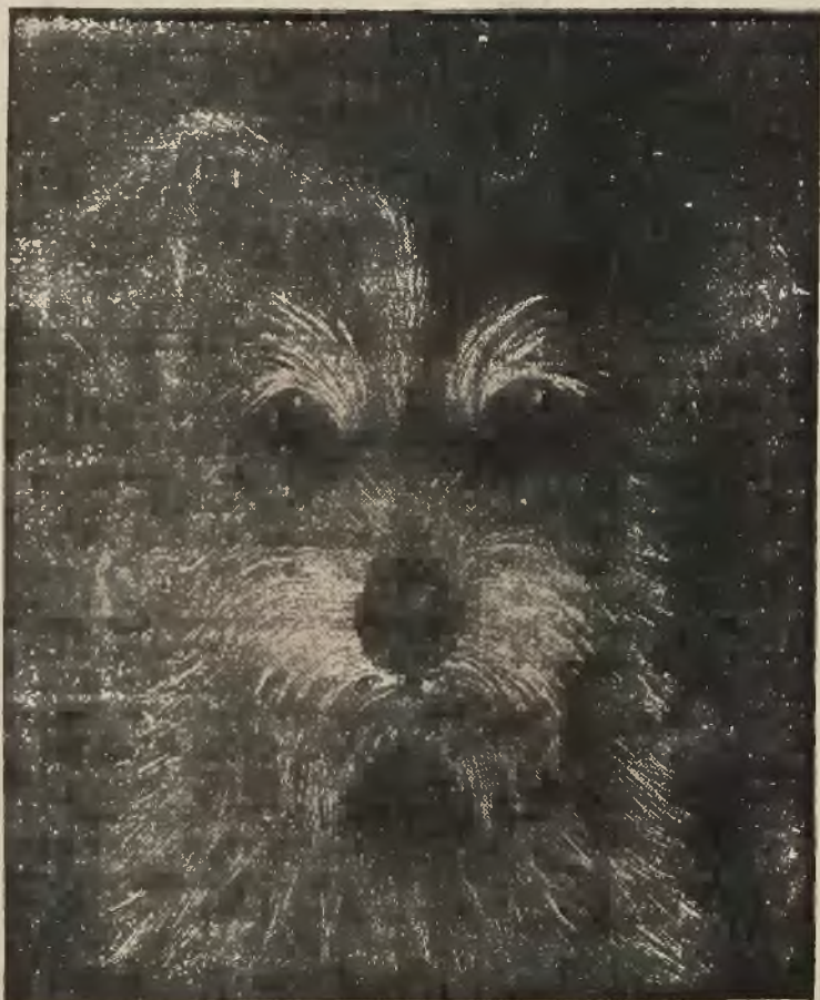
7. IANINA NOWOTNOWA. „Raffi” — drzeworyt. Cena 6 zł.