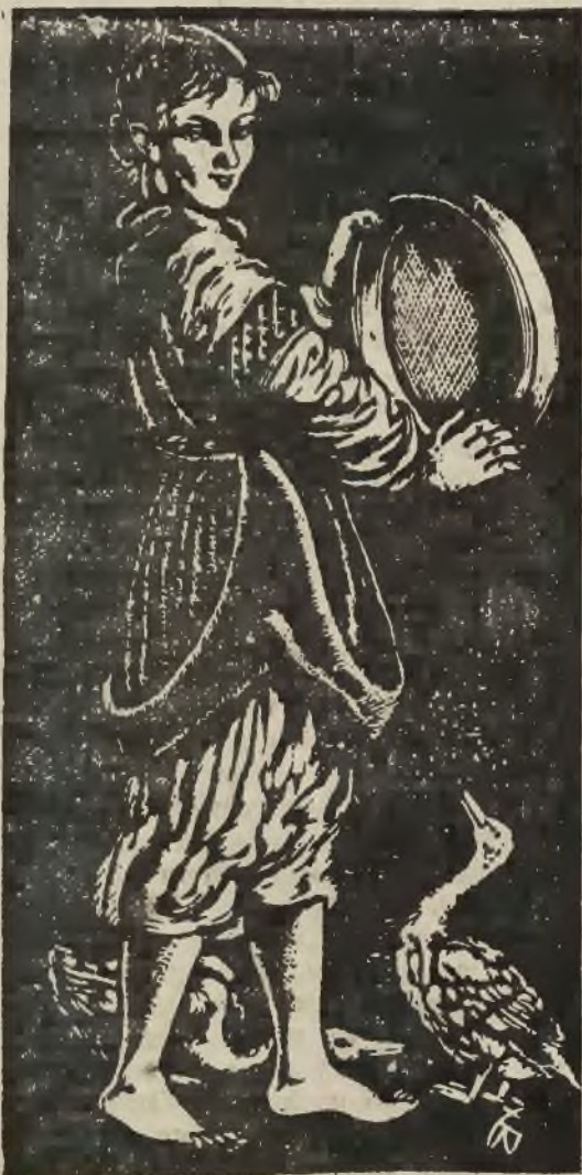
9. WŁADYSŁAW ŻURAWSKI. „Dziewczyna z przelakiem” — drzeworyt. Cena 7 zł.