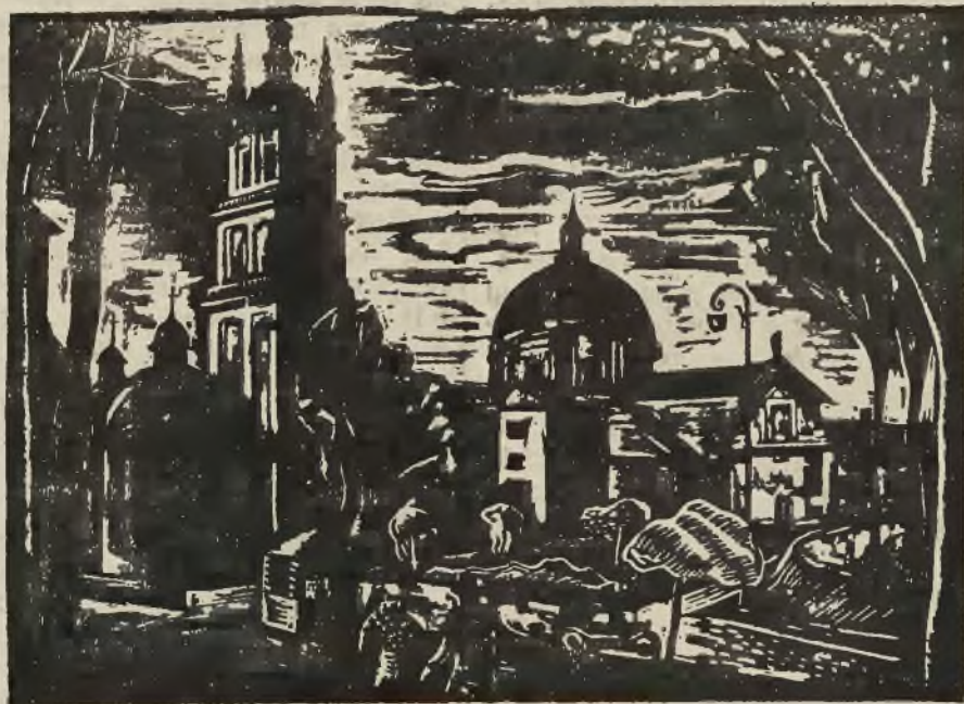
8. LUDWIK TYROWICZ. „Wiaok z Podwata” — drzeworyt. Cena 6 zł.