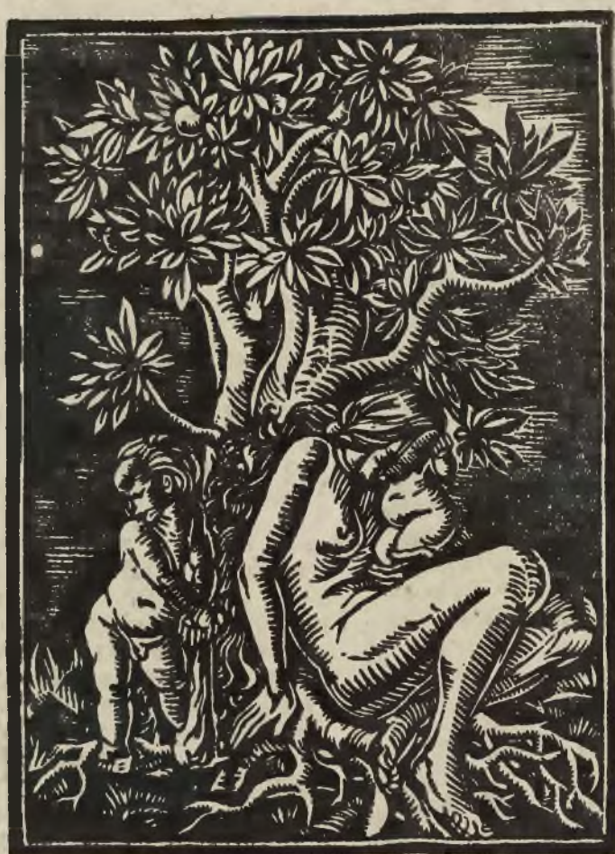
11. ZOFJA STANISŁAWSKA. „Kain i Abel” — drzeworyt. Cena 5 zł.