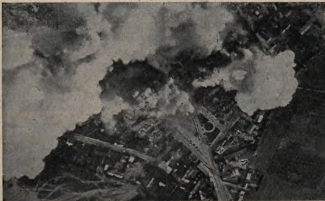
Modlin pod bombami

Niepowodzenie kampanii wrześniowej było niepowodzeniem materialnym. Duch Polski nie poniósł klęski na wrześniowych i październikowych polach bitew, lecz wzmocnił się i poprzez cierpienia i ból trwa dalej niezłomie na raz zajętych stanowiskach.