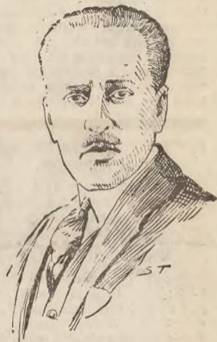
MIN. SPRAW ZAGRAN. SKRZYŃSKI po naradach z Herriotem opuścił Paryż i udał się do Genewy.