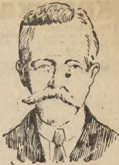
HENRYK CABOT LODGE wybitny senator Stanów Zj. zmarły niedawno w N. Jorku.

Warszawa, 31. grudnia. (Z.) Rząd bułgarski — jak donoszą z Paryża — odnosi się obecnie przychylnie do Wranglowców, nie jak to było za czasów premiera Stambulińskiego, który przeprowadził wydalenie Wranglowców z kraju. Mniejsze oddziały Wranglowców mają być również zorganizowane w Bułgarii i Rumunii.