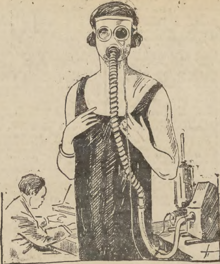
Dama, uzbrojona w coś nakształt okularów i w rure, przypominającą przyrząd nurkowski, jest śpiewaczką, demonstrującą świeżo wynaleziony aparat, wzmacniający głos i potęgujący czystość brzmienia.