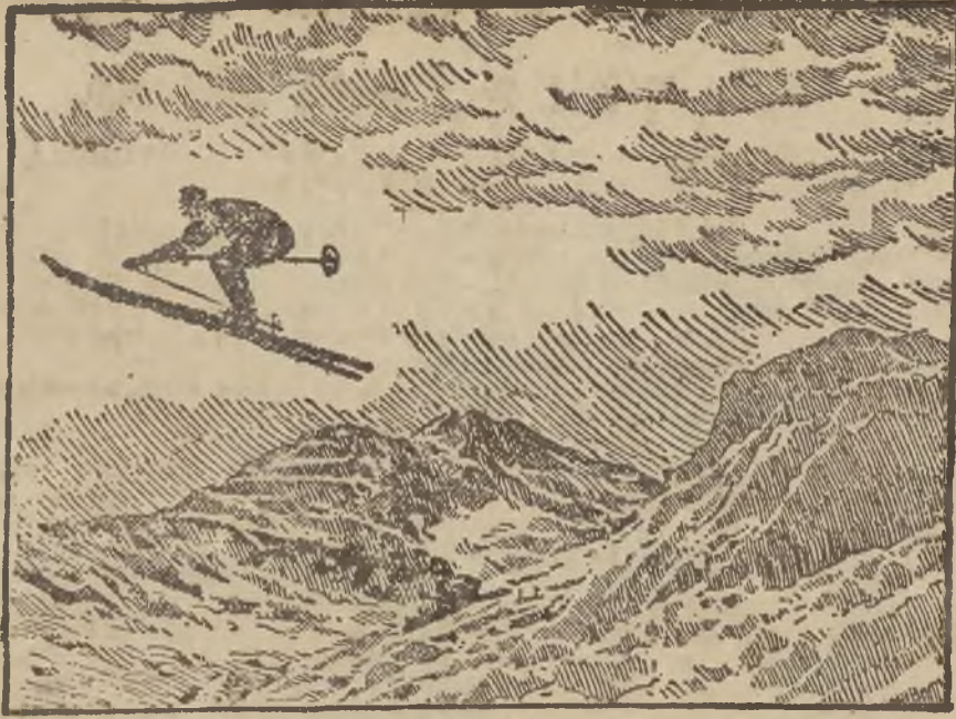
Udatne zdjęcie, przedstawiające niezwykle wysoki skok na nartach, wykonany podczas zawodów w St. Moritz (Szwajcaria). Tego rodzaju widok wzbudzi osłonek naszych narciarzy, którzy z tęsknotą, lecz nadaremnie wyczekują opadów śnieżnych.