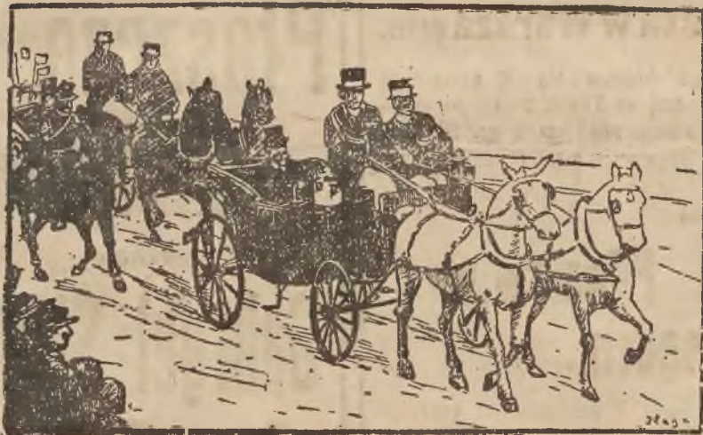
ROCZNICA NARODOWA W WARSZAWIE. Prezydent Wojciechowski udający się na raut w dniu 3-go maja.