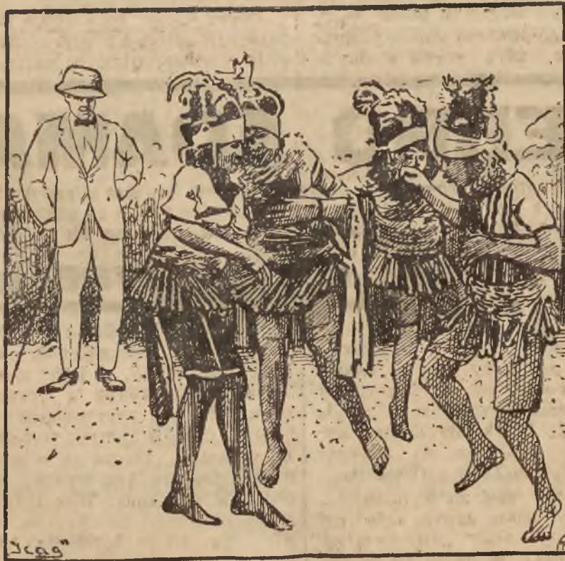
HONOROWY TANIEC PRZED KSIĘCIEM WALJI.

Warszawa, 13 maja. (w.). „Kurjer Warszawski” donosi, że w Moskwie odebrał sobie życie znany socjal-rewolucjonista rosyjski Borys Sawinkow, którego niedawno oddane się w ręce bolszewików i sąd nad nim wywołały tyle głośniejszych komentarzy w prasie europejskiej, szcze gólnie zaś wśród rosyjskiej emigracji. Z doraźnych wiadomości wynika, że Sawinkow w trzymany przez bolszewików w więzieniu moskiewskim wielokrotnie nalegał o szybsze rozstrzygnięcie jego sprawy. Gdy mu odówiono, postanowił tortury swe zakończyć śmiercią. Korzystając z okazji wyerowadzenia go na korytarz więzienny, rzucił się z 4 piętra i poniósł śmierć na miejscu. Dalszych szczegółów brak.