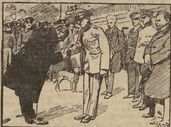
PO ZAMACHU W BULGARJI

Król Borys przyjmuje gratulacje składane mu przez premiera Cankowa z powodu szczęśliwego ocalenia.