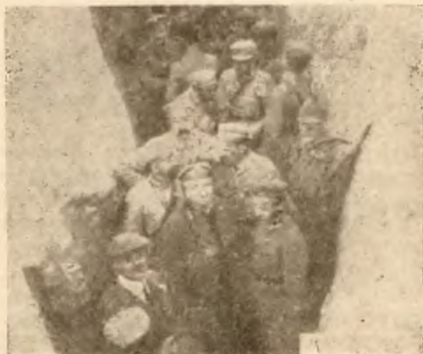
Ks. Biskup Bandurski w okopach I. Brygady w 1916 r.

Odeprzemy wszystkie wysiłki szatańskich niszczy-cieli, pokonamy wszystkie zamiary, pohańbiające nasze dzisiejsze istnienie, nie uronimy jednego słowa z naszej mowy, nie zapomnimy jednej pieśni polskiej, nie damy jednej piędzi ziemi, nie zgasimy jednego promienia na-