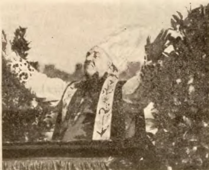
Ks. Bisk. przemawia na Polu Mokotowskim w rocznicę 10-lecia Niepodległości