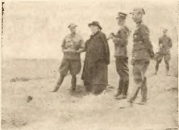
Na froncie legjonowym.