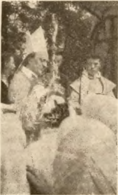
Ks. Biskup udziela Sakr. Bierzm.

przeliczony tłum ciekawych w dniu tym dosłownie obległy katedrę. Wszyscy cieszyli się i radowali, wszyscy nieśli Kochanemu Pasterzowi szczerą hołd za Jego dla nich trud, pracę i miłość. Niestrudzony Kapłan - Patrjota nie pomija żadnej sposobności służenia sprawie narodowej. W roku 1907 w rocznicę powstania listopadowego rozbrzmiewa z ambony kadetery lwowskiej Jego gromki głos: „Budujcie Polskę! Murujcie dom polski silny i niezachwiany w posadach cnót i zasad narodowych. Murujcie szkołę polską silną i niezachwianą w zasadach obowiązku, prawd religijnych i narodowych. Murujcie społeczne życie polskie, nie na modłę obcą, ale oparte na zgodzie wszystkich warstw i stanów, życie idące naprzód, rwące się do postępu w zdobyczach naukowych i przemysłowych, w urzędzeniach praw równych i obowiązków równych“.