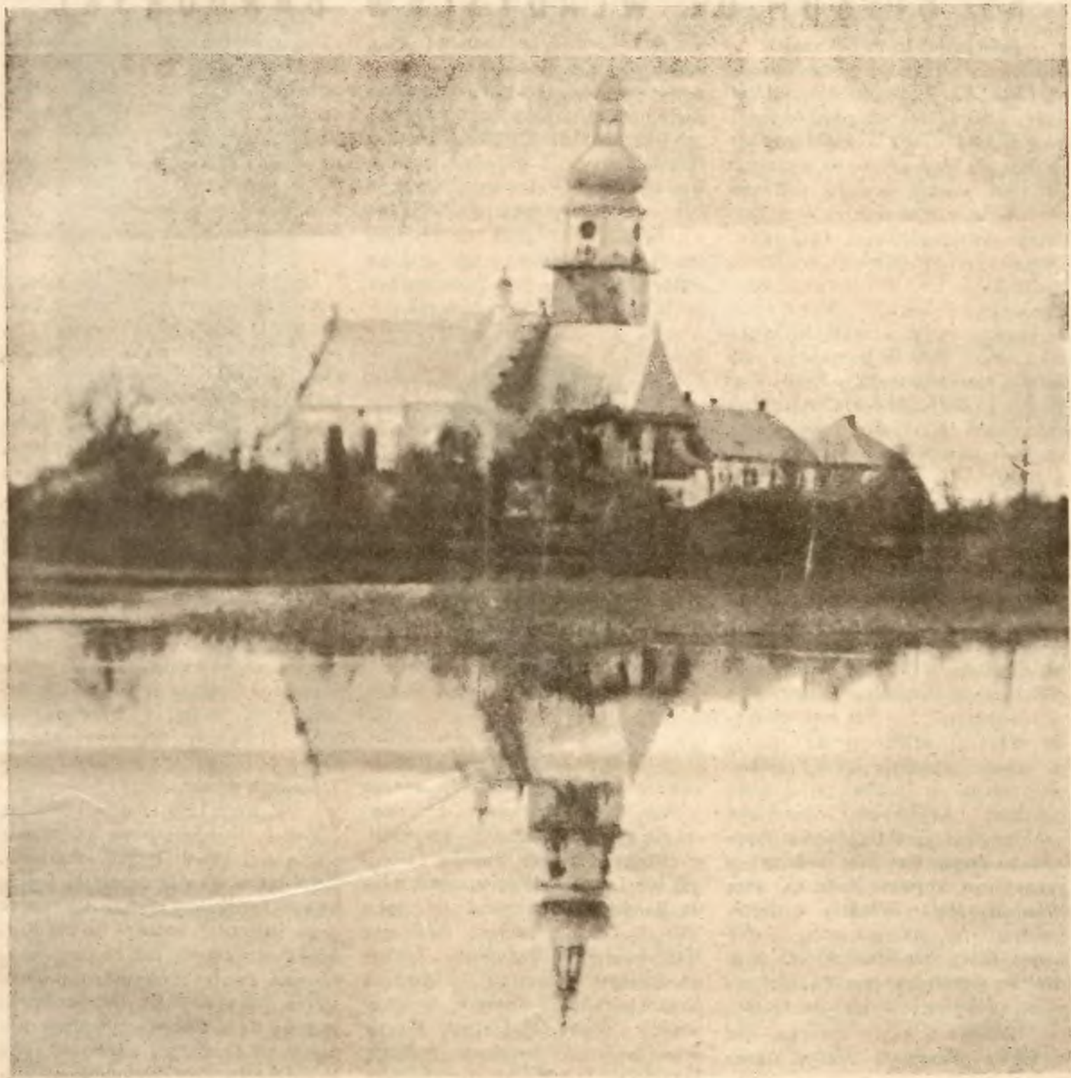
Kościół OO. Bernardynów w czasie wiosennego wylewu Bugu.