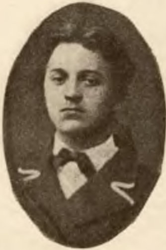
Uczeń VIII. kl. gimn.