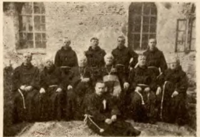
Wśród braci zakonnych w klasztorze sokalskim.

W służbie Boga, cnoty, prawdy i miłości jarzmo słodkie a brzemień lekkie, bo to jarzmo Chrystusowe... Tak bywa i w życiu, w poznaniu obowiązków wobec