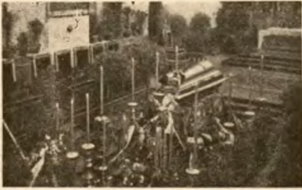
Zwłoki Ks. Bisk. Bandurskiego podczas pontyfik., żałob. nabożeństwa 12 marca 1932.