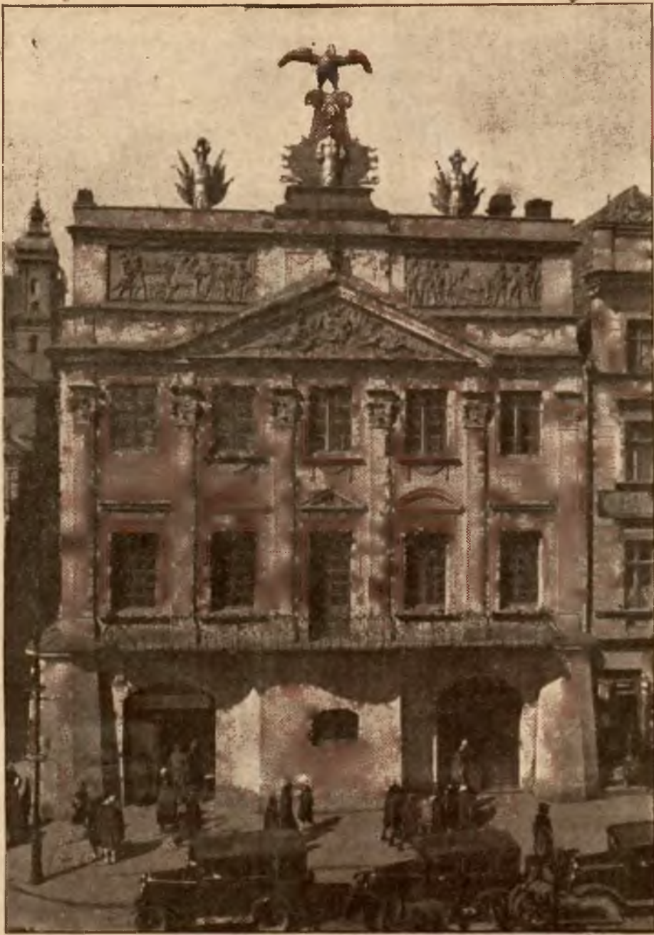
Pałac Działyńskich na Starym Rynku, jeden z najwspanialszych zabytków budownictwa z początku XIX w.

jakimś nadzwyczajnym sposobem się nie zbiły, co wzbudziło ogólny entuzjazm, gdyż poczytywano sobie ten fakt za dobrą wróżbę. Trębacz hejnałem z wieży obwieszczał miastu przez całą dobę, godzinę.