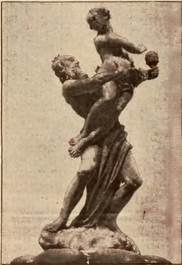
Figura „Porwanie Prozerpiny”, znajdująca się na studni na Starym Rynku.

w Królestwie rewolucji r. 1831, zaczęła się dla W. Księstwa epoka wzmożonej germanizacji. Usuwano Polaków z zajmowanych stanowisk, a język polski ze szkół i urzędów, kasowano klasztory, zabierając ich majątki, piększano miasto pomnikami niemieckimi, podtrzymywano specjalny kierunek w architekturze, by zatrzeć resztę polskiego charakteru miasta.