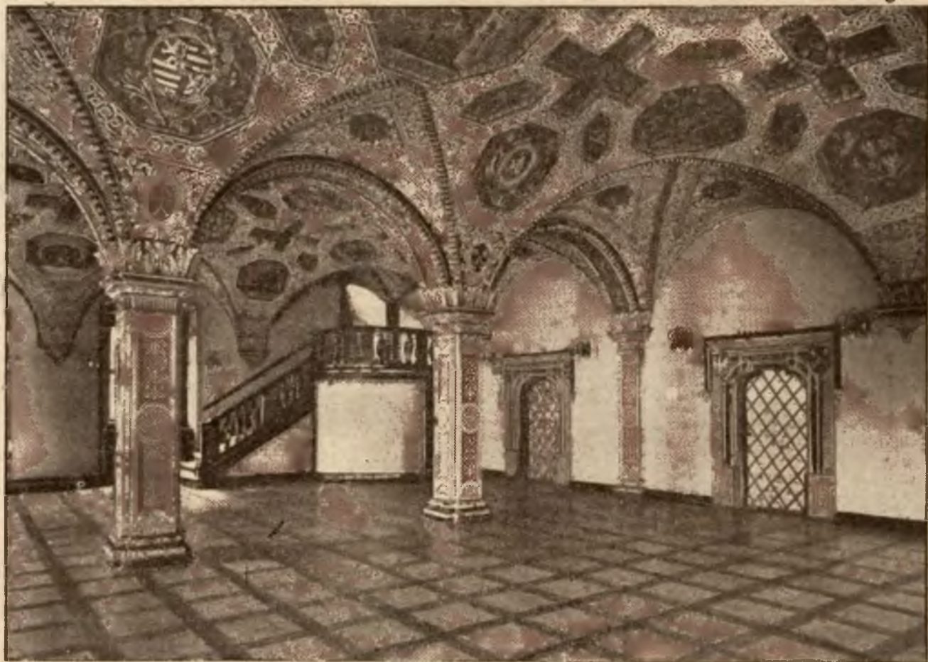
Sala narodzenia w ratuszu z p. zna. ktm.