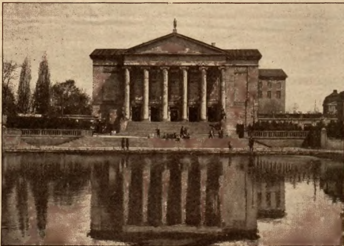
Teatr Wielki, gdzie według aktu erekcyjnego nie miało nigdy rozbrzmiewać słowo polskie.