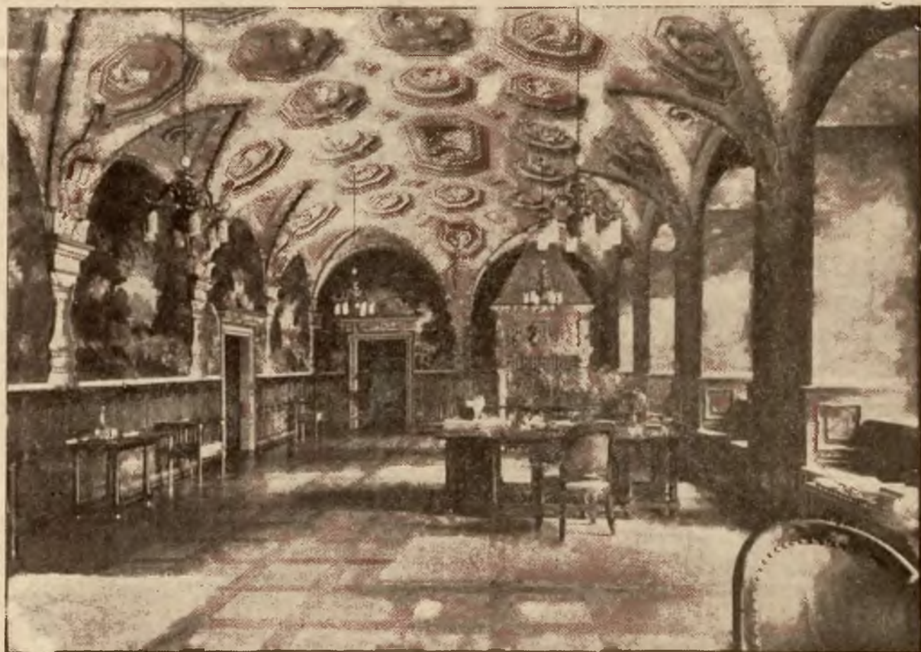
Sala królewska w ratuszu poznańskim.