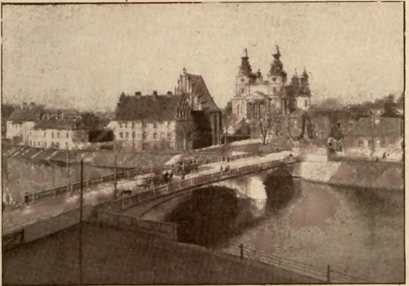
Widok na katedrę, Ostrów Tumski i most Chrobrego.