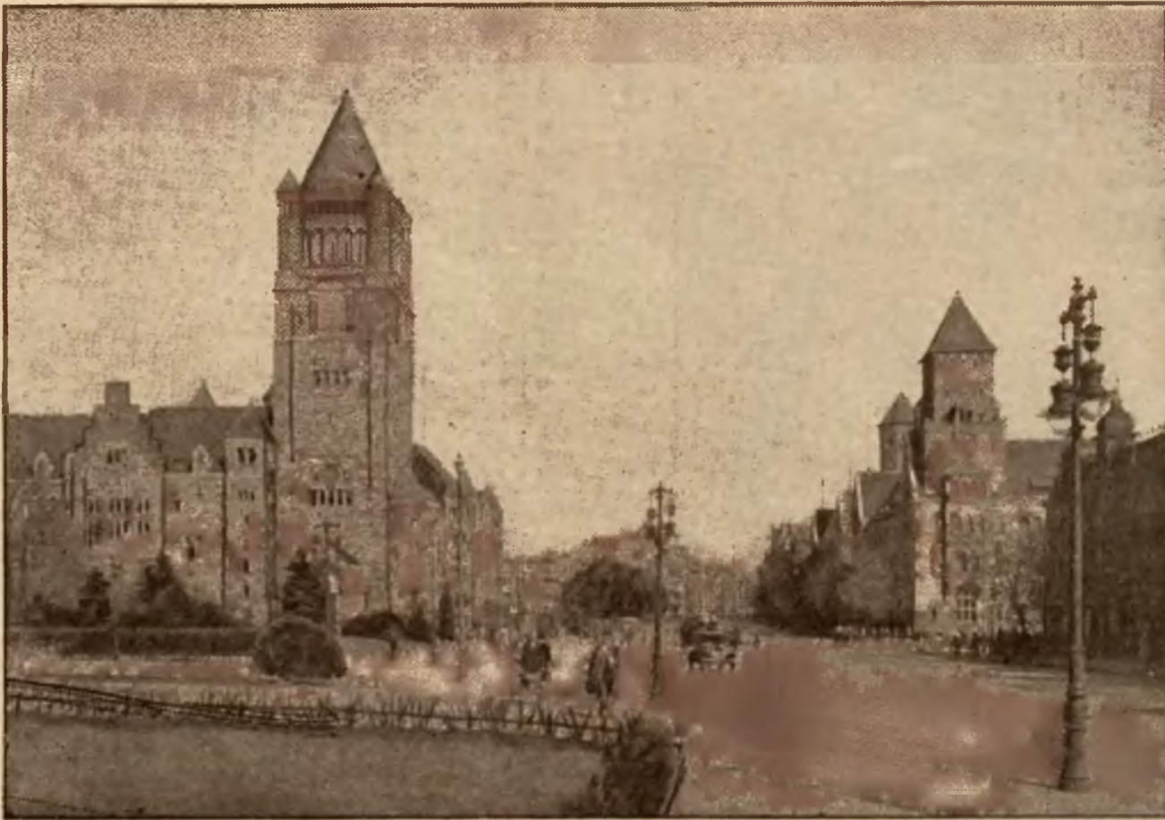
Widok ra dawny zamek cesarski, gdzie dziś mieści się częściowo Uniwersytet Poznański.